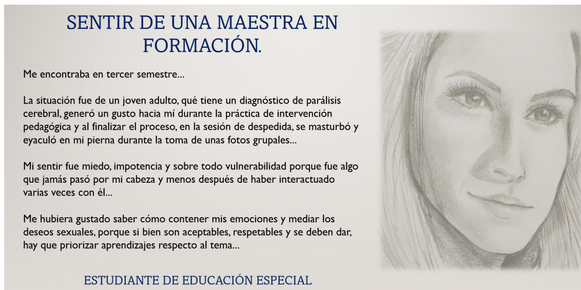
Figura 1. Sentir de una maestra en formación