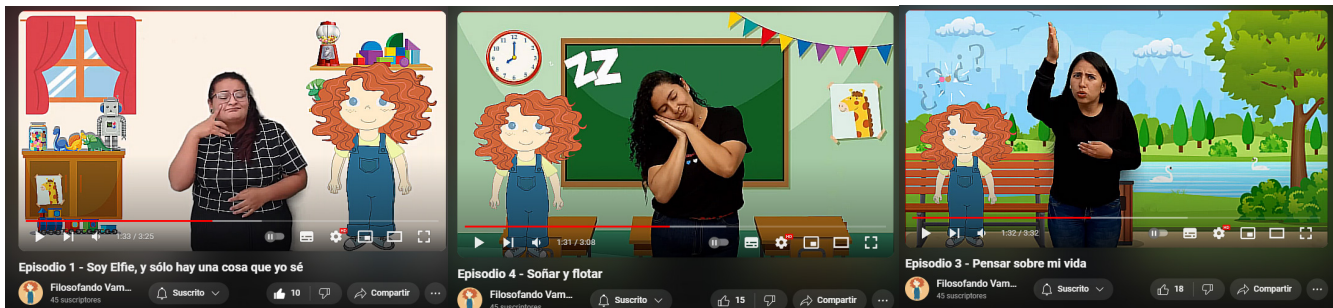
Figura 2. Texto visual de Elfie

nidad sorda, en donde la información se interpreta de manera meticulosa, transformando el texto de código escrito a un texto estructurado en Lengua de señas (LS) (García et al. , 2021); textos que contaron con apoyo visual, como lo fue la personificación de los personajes dibujados por una de las docentes y la ambientación espacial que sumergía al lector en la historia. Los textos se encuentran disponibles en el canal de YouTube: Filosofando vamos .