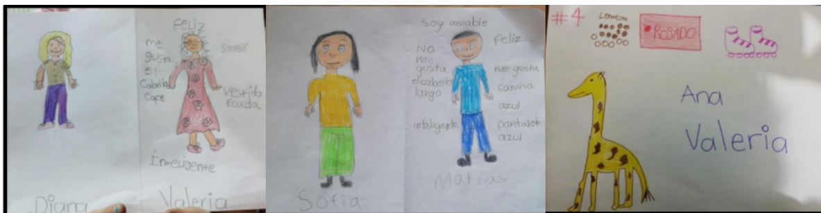
Figura 3. Exposición de expresiones artísticas realizadas por los niños

Para esta etapa se implementaron dos episodios: soñar y flotar y ¿pensamientos claros o pensamientos claramente conectados? , los cuales se desarrollaron en dos sesiones cada uno y tuvieron como eje de trabajo las expresiones artísticas como dibujo, moldeado en plastilina, collage, entre otras. Los protagonistas de las sesiones eran los niños, por lo que hubo mínima mediación de las docentes y se construyó de manera colectiva. Para el cierre de la propuesta se realizó una exposición artística donde los estudiantes hablaron de sus aprendizajes y de cómo fue el proceso.