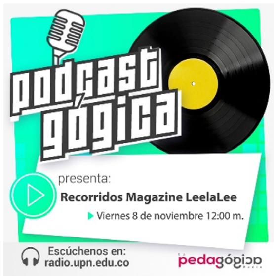
Figura 2. Pieza de comunicación Podcastgógica

Aunque la continua rotación de monitores que apoyan semestralmente al Magazín por medio del Centro de Investigaciones de la Universidad Pedagógica (CIUP) suele interrumpir los procesos editoriales, esto se percibe como un desafío latente, aunque es compensado con la posibilidad de contar con la diversidad que caracteriza a cada estudiante en ideas, miradas, perspectivas y conocimientos para lograr el alcance de los objetivos propuestos.