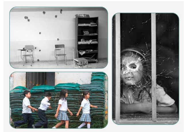
Figura 3. Imágenes de la exposición El testigo de Jesús Abad Colorado

La exposición fotográfica “El testigo”, de Jesús Abad Colorado, es un testimonio visual que revela cómo la violencia se apodera incluso de la escuela, espacio dedicado al aprendizaje y a las infancias. En estos entornos el juego no solo es interrumpido, sino que es remplazado por miedo, desconfianza y angustia, incidiendo en el pleno desarrollo integral de los NNA, siendo necesario resignificación y construcción a través de la memoria y el afecto.