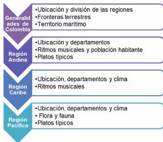
Figura 3. Regiones y unidades temáticas del grupo de niños