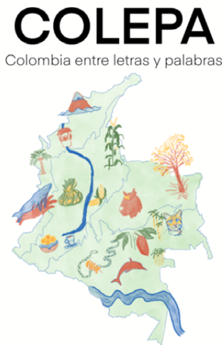
Figura 1. Portada libro COLEPA

(Neuta et al. , 2025, p. 23). Como respuesta a este objetivo se realiza el libro de texto en Lectura Fácil denominado COLEPA (figura 1).