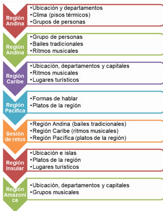
Figura 4. Regiones y unidades temáticas grupo adultos