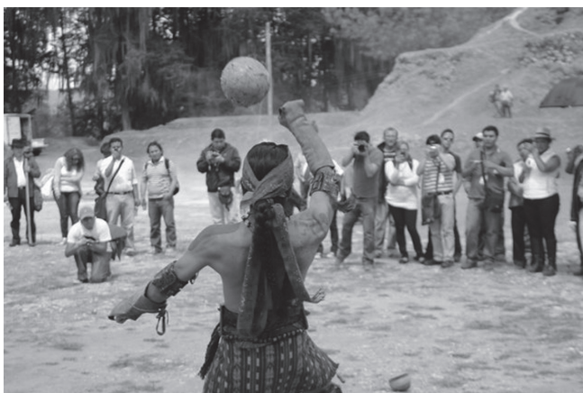
Ilustración 2 7

Con los años fueron sucediéndose ajustes operativos, administrativos y de utilería, a la par de lo propio con la rotación de miembros del grupo. Paulatinamente los jugadores de pelota maya llegaron a ser en su totalidad miembros de diferentes grupos lingüísticos de etnia maya. Cuando nos conocimos con sus miembros en el año 2011, tres jugaban y uno cuarto coordinaba y hacía la narración durante las presentaciones. Dado que en el campo siempre hacía falta un jugador, fui invitado a participar. El esquema actual del grupo es similar; aunque el Micude ha contratado jugadores para conformar dos equipos. Esto para atender la demanda del programa “Viajes al mundo maya” (Ilustración 2), en el marco de los eventos preparatorios al 21 de diciembre (Prensa Libre, 2012).