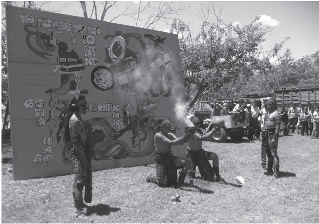
Ilustración 1 6

La metodología de indagación para conversar sobre las subjetividades en el chaaj, han sido las memorias cotidianas captadas a través de video, fotografía y audio que en cada juego se recogen. El uso de estas tecnologías permitió la reproducción más expedita y ágil posible del friso en el tablero de juego. Para la escritura del presente artículo, revisamos con el grupo de jugadores un número aproximado de 3000 fotografías, 50 videos y 10 relatos en torno al chaaj. Con las contemplaciones del material fue-