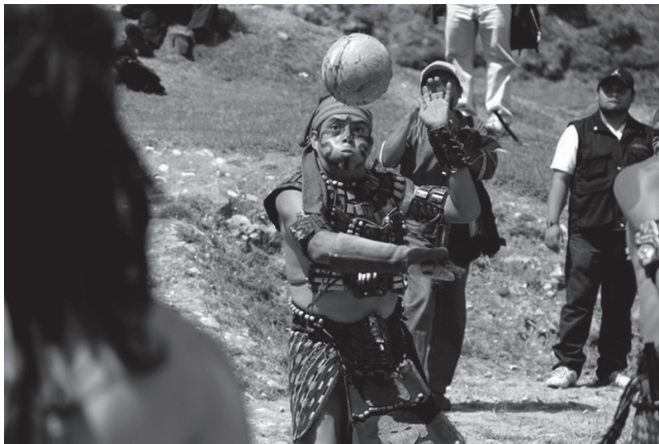
Ilustración 3 9

Todo en el juego de pelota es movimiento y equilibrio. Los cuatro jugadores, los cuatro puntos cardinales del universo, se mueven incesantemente de un lado al otro, brincan, se agachan, suben, bajan, hacen movimientos de rotación y traslación, giran sobre sí mismos. La pelota igual o aún más intensamente gira, golpea, sube y baja, gira sobre sí misma. El caucho sagrado va del cielo a la Tierra, de jugador a jugador; los rincones del universo, de pared a pared, figurando el movimiento, el desplazamiento astral, el gran equilibrio y las energías universales. (Cabrera, 2007 p. 332)