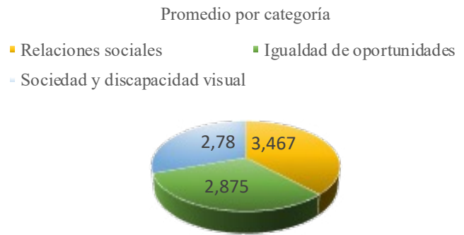
Figura 1. Diagrama circular – Promedio por categorías Escala de Actitudes de los escolares.

Así, se utiliza la “escala sobre las actitudes de los escolares hacia la discapacidad visual”, propuesta por Cordente (2018) y adaptada al contexto en específico para facilitar su comprensión y aplicación. Se presenta como una escala tipo Likert del 1 al 4, que muestra qué tanto están de acuerdo (4) o en desacuerdo (1) con los ítems presentados. El instrumento se divide en tres categorías, sociedad y discapacidad, igualdad de oportunidades y relaciones sociales. Desde allí, se desarrollan aspectos relacionados con la participación que tienen las personas en situación de discapacidad visual dentro de la sociedad, la educación y el deporte.