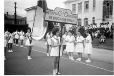
Arte de la Convocatoria hecha a la comunidad académica desde la página del IDEP.

IDEP - Bogotá @idepbogeta Convocatoria comunidad académica Muestra Fotográfica 80 años Educación Física bit.ly/1GF1K4V @paulomolin