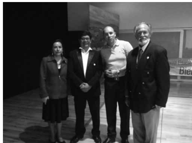
Apartes de la gala y colaboradores en la logística de la ceremonia.