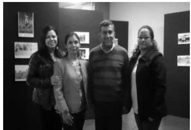
Exhibición de la gran exposición fotográfica itinerante 2015-2016.