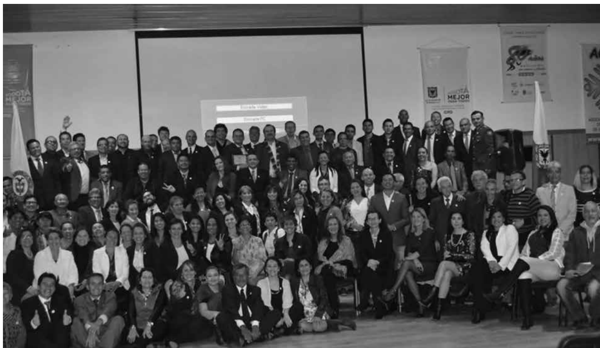
Participantes en la gala de lanzamiento de la celebración de los ochenta años de la Educación Física como Profesión en Colombia. Salón Presidente IDR, sábado 25 de junio de 2016.