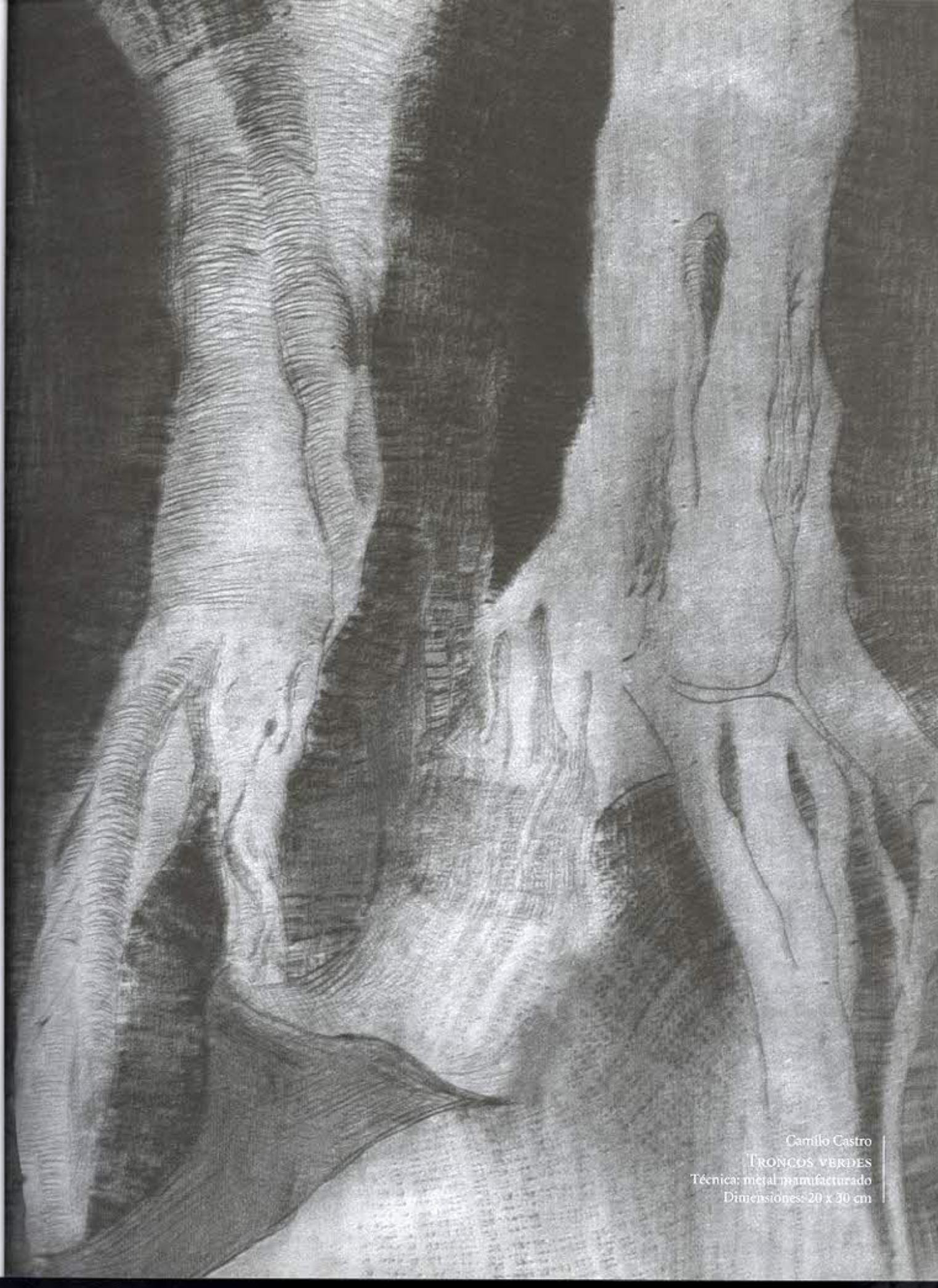
Camillo Castro TRONCOS VERDES Técnica: metal manufacturado Dimensiones: 20 x 30 cm