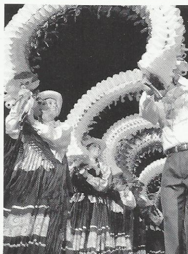
Grupo de proyección de Danzas folclóricas UPN Presentación en el auditorio de la Fundación Gilberto Alzate Avendaño