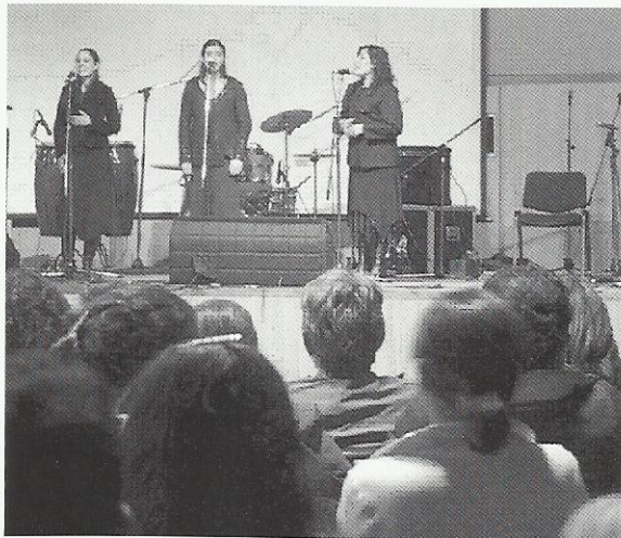
Presentación IDRDR Trío vocal UPN Informe Integral de Gestión y Muestra Cultural "Voces, ritmos, y expresiones" // Salón Presidente IDRDR, noviembre 8 de 2006.