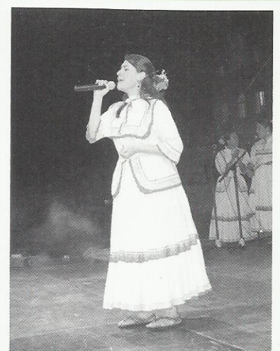
Grupo Percusión de los litorales-Son del Mar-UPN Día mundial de la actividad física y el folclor aeróbico // IDRDR-Plaza de Bolívar.