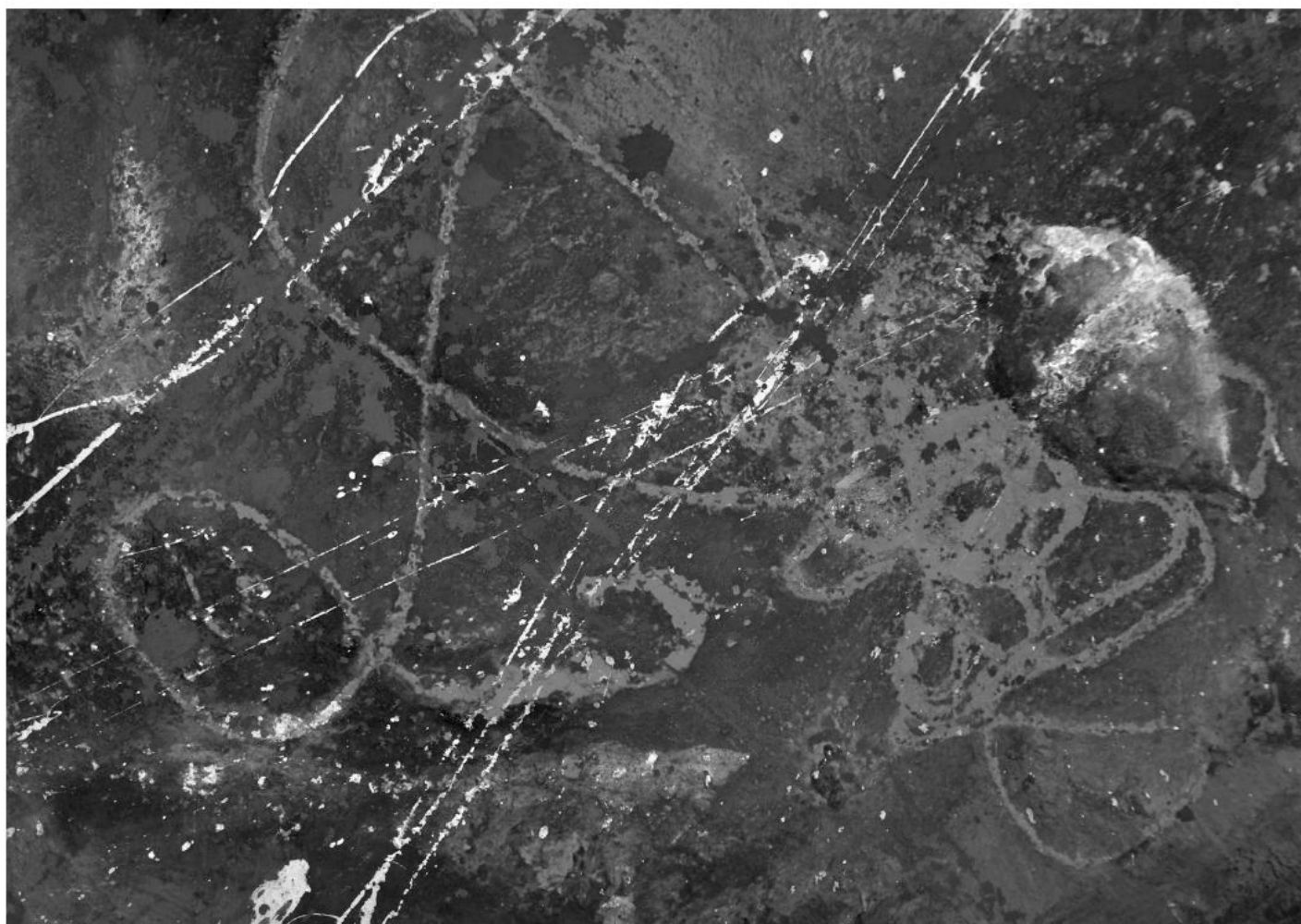
Sergio Giraldo Giraldo » Título: Sin título (ref. No.) » Técnica mixta: (Pigmentos minerales, brea, acrílico, fique, fuego, objeto) » Dimensiones: 100cms. x 70cms.