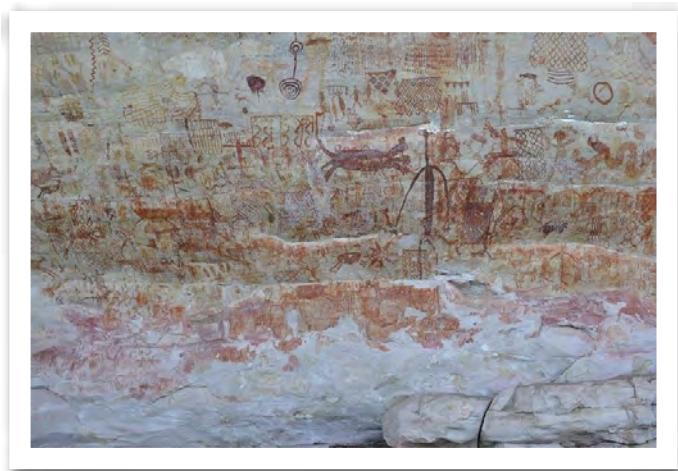
Figura 5. Mural de Nuevo Tolima -Fragmento sector izquierdo-. Parecería inequívoca la identificación de un cuadrúpedo, semejante a un venado saltando. Se encuentra al lado de representaciones ejecutadas con otros pigmentos, que invitan a pensar superposiciones de ejecutores y de épocas distintas.