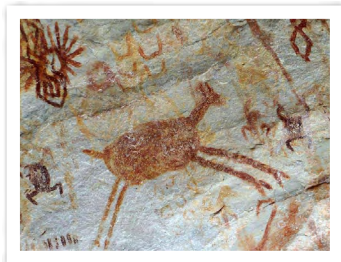
Figura 4. Mural de las Dantas, Cerro Azul -Fragmento-. Detalle del mural donde se representan motivos que parecerían hacer referencia a aves y mamíferos en movimiento, de dos especies en secuencia ordenadas. Al igual que en una buena proporción de las representaciones en los murales de la Serranía de La Lindosa, difícilmente son identificables las especies que están allí incluidas. Mas parecen elaboraciones intelectuales que animales que existan.

Fuente: Corporación Gipri Colombia (2018).