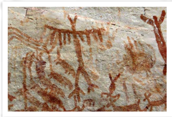
Figura 7. Mural de Nuevo Tolima - sector central. Pinturas en rojo y blanco con diversos tonos de óxidos ferrosos. La composición como tendencia general vuelve a incluir animales diversos desde mamíferos, aves y reptiles, y aparentemente un felino central con garras acentuado en su tamaño. Al lado de este, y con un tono oscuro, una figura antropomorfa alargada y fantasmal, muestra la intención expresa de presentar escenas de las tradiciones culturales complejas relativas a las nociones de realidad de los intelectuales pintores.