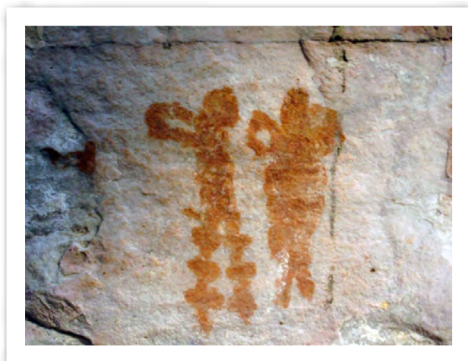
Figura 3. Mural de las Dantas, Cerro Azul -Fragmento-. Detalle pequeño del sector izquierdo del mural general. Aparentemente se trata de dos motivos humanos, que parecerían estar en conversación, movimiento, como en una ceremonia con trajes vistosos y decorados.