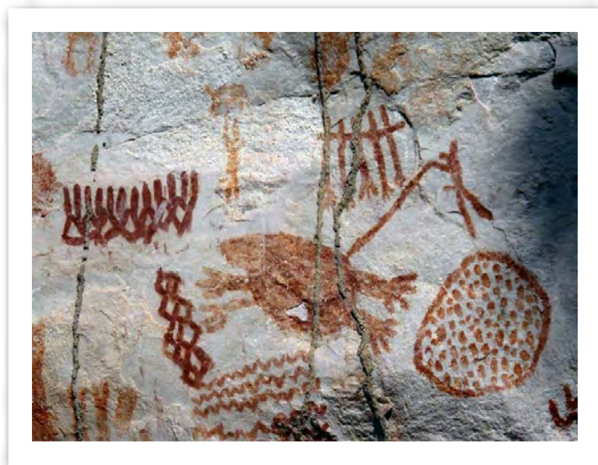
Figura 1. Mural de las Dantas, Cerro Azul -Fragmento- Detalle del mural donde aparentemente se representa una actividad de cacería de un cuadrúpedo. La identificación del tipo de animales requiere de investigaciones adicionales. La simplificación de los trazos y la variedad de pigmentos parecería indicar distintas etapas en la ejecución de los murales.