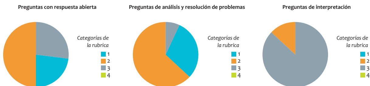
Figura 4. Resultados prueba diagnóstica curso 11-01.