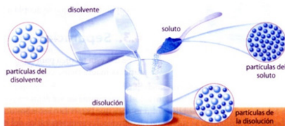
Imagen 1. Mezclas y sustancias puras.

3. Observe detenidamente la siguiente imagen, y de acuerdo con ella responda: