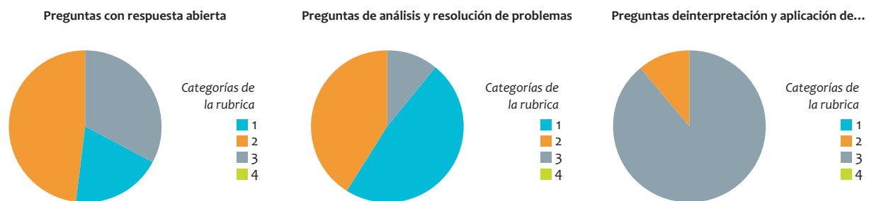
Figura 2. Resultados prueba diagnóstica curso 11-04.

De acuerdo con esto, se presentan los siguientes resultados: