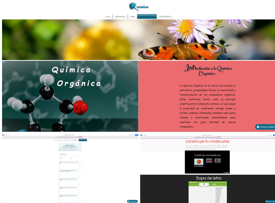
Figura 1. Capturas de pantalla de la página web