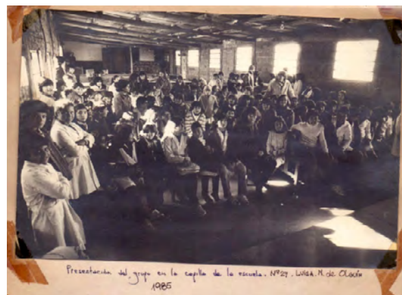
Figura 1. Fotografía que acompaña el informe elaborado por los estudiantes del TAE Ludueña: Presentación del grupo de estudiantes del TAE Ludueña en la capilla de la escuela del barrio. Se optó por conservar la materialidad original de la fotografía pegada con cinta en el informe, así como el pie de foto escrito a mano por los estudiantes. Informe TAE Ludueña, 1985