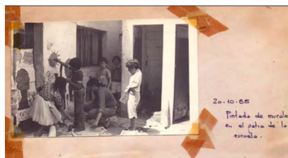
Figura 2. Fotografía que acompaña el informe elaborado por los estudiantes del TAE Ludueña: Pintada de murales en el patio de la escuela. Se optó por conservar la materialidad original de la fotografía pegada con cinta en el informe, así como el pie de foto escrito a mano por los estudiantes. Informe TAE Ludueña, 1985