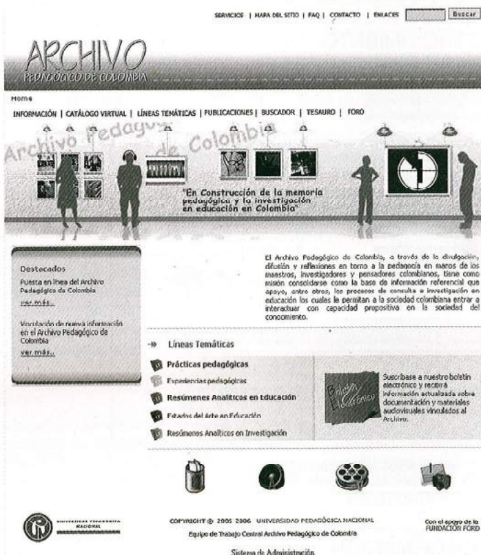
FIGURA 1. HOME DEL PORTAL DEL ARCHIVO PEDAGÓGICO DE COLOMBIA (HTTP://ARCHIVO.PEDAGOGICA.EDU.CO) DONDE SE ENCUENTRAN LAS RELACIONES DE ESTRUCTURA Y LÍNEAS TEMÁTICAS 10 .