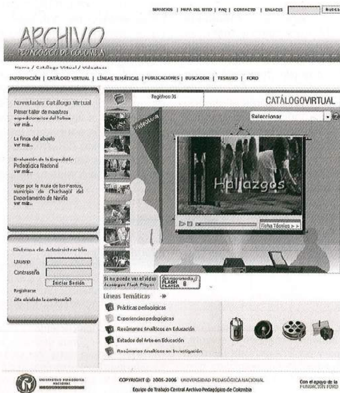
FIGURA 3. SABER, EXPERIENCIA Y CONOCIMIENTO DE MAESTROS E INVESTIGADORES EN EDUCACIÓN A DISPOSICIÓN DEL PÚBLICO EN GENERAL EN LA VIDEOTECA DEL ARCHIVO PEDAGÓGICO DE COLOMBIA 21 .

y organización no resuelve el problema de fondo que se encuentra relacionado con el reconocimiento del conocimiento que circula entre líneas en los contenidos propios de información. Proceso que conduciría a la gestión del conocimiento como estrategia mediante la cual los sujetos, que integran una organización o comunidad, tienen la oportunidad de compartir su conocimiento tácito y, a su vez, tienen la posibilidad de intercambiarlo de modo que pueda convertirse en conocimiento explícito, puesto a disposición de una comunidad de usuarios en beneficio