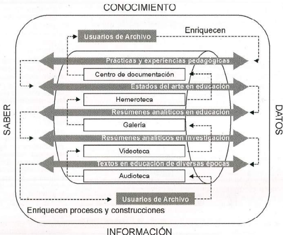
FIGURA 2. PROCESO DE RECURSIVIDAD EN EL ARCHIVO PEDAGÓGICO DE COLOMBIA 14