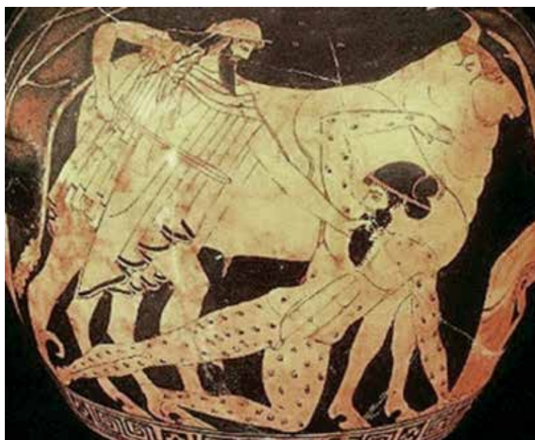
Imagem 1. Hermes e Argos Panoptes

Ou um corpo que agencia todas as percepções, metáforas e experiências para compor o jogo do ver? Uma imagem que compõe com o que Foerster (1996) nos traz como sentido outro para o ver, trazendo a percepção do corpo como um todo. Que outras imagens nos são possíveis quando implicamos todos os outros sentidos no ato de ver, e não somente o sentido da visão?