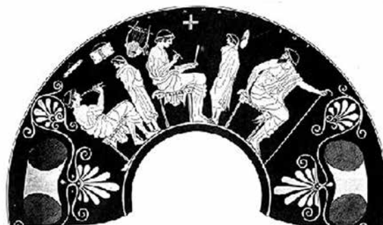
Figura 1. Escena en la escuela. 480 AEC. Antikensammlung, Staatliche Museen, Berlín, Alemania.

Una de las imágenes más antiguas que tenemos del paidagogos muestra con claridad que esta figura no se puede identificar directamente con la de maestro (véase la figura 1). En esta imagen vemos cómo los maestros confraternizan con los alumnos, mientras que el pedagogo (que por lo general sostiene un báculo) se sienta frente a uno de ellos.