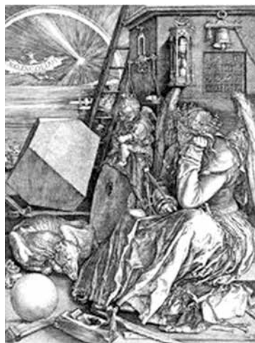
Figura 1. Albrecht Dürer, 1514

proeminência na idade moderna, era atribuída à produção da bile e acompanhava-a a tristeza, o entusiasmo e a falta de envolvimento. Foi sucedânea da acedia dos tempos medievais, vista como um poder demoníaco que poderia vir a cada momento e tomar conta da pessoa, infligindo tédio e falta de vontade. Especialmente entre os monges, esse era um pecado grave porque lhes tirava o ânimo de ler e de rezar. Hoje não se fala mais nem de acedia como pecado, nem de melancolia como problema fisiológico, mas de depressão como estado psíquico a ser tratado com medicamentos ou psicoterapia. Ou seja, este é o argumento da autora, as maneiras de “sentir” são ressignificadas na história, podem receber outros nomes e ser atribuídas a outras causas.