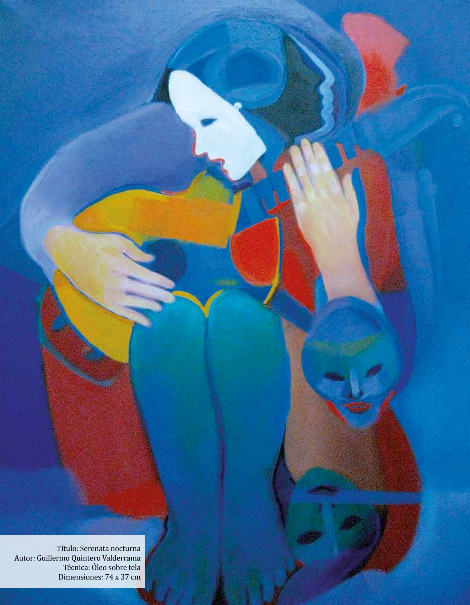
Título: Serenata nocturna Autor: Guillermo Quintero Valderrama Técnica: Óleo sobre tela Dimensiones: 74 x 37 cm