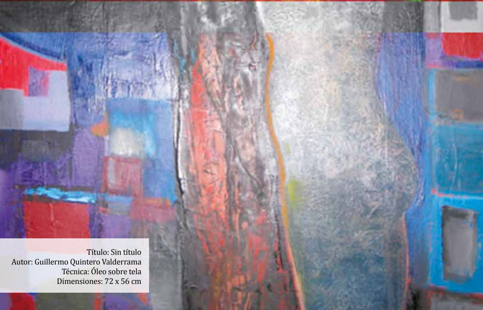
Título: Sin título Autor: Guillermo Quintero Valderrama Técnica: Óleo sobre tela Dimensiones: 72 x 56 cm