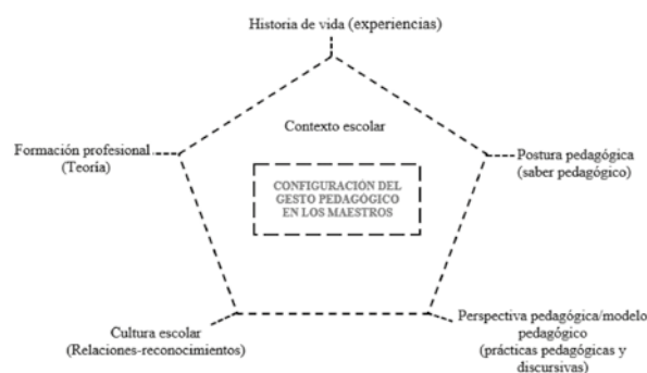
Figura 1. Configuración del gesto pedagógico en los maestros

Así, es necesario comprender los gestos pedagógicos no solo en el sentido de describirlos como parte de los procesos comunicativos, sino desde los efectos que tienen en la vida escolar, las prácticas que engendran, las características que tienen, las formas de expresión y los sentidos que adquiere en las relaciones de los maestros y los niños, en el contexto de la escuela rural. Por tanto, aunque el gesto pedagógico puede estar vinculado a la comunicación no verbal, podemos ir más allá en la comprensión de este en el contexto escolar, en el sentido de que “permite ser develado e interpretado a la luz de sentimientos y actitudes” (Ospina, 2008), es decir, lo que el maestro expresa en su ejercicio de enseñanza, como lo hace, pero también su actitud frente a este ejercicio. De igual manera, como se expone en la figura 1, estos gestos pedagógicos parecen estar relacionados con la formación del maestro, con sus posturas epistemológicas y teóricas, con su ejercicio docente, con sus experiencias de vida y su discurso y actitud para desarrollar su labor pedagógica. Es decir, en cada maestro finalmente se configura un(os) gesto(s) pedagógico(s) como resultado de la relación de todos estos componentes, el cual aflora en el contexto escolar cuando ejerce su práctica pedagógica.