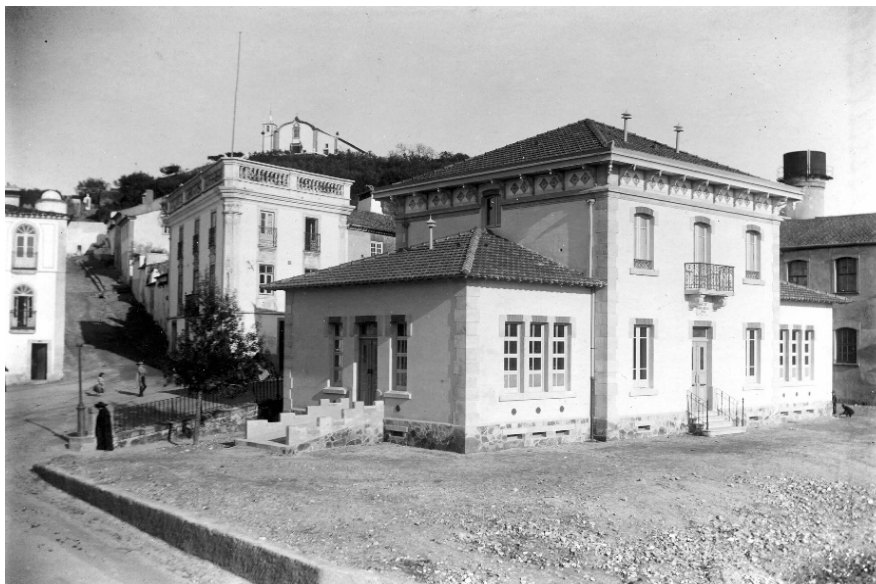
Fotografia 1. Instalações da Creche João Baptista Rollo, 1905.