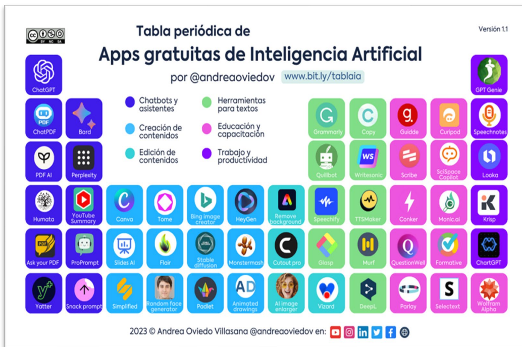
Figura 1. Tabla periódica de herramientas de IA para matemática y otros