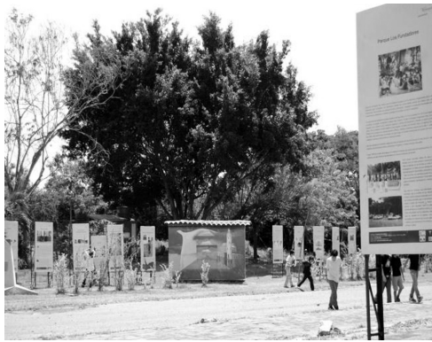
Echamos a rodar la memoria en Armero

Este sitio, desconocido por un alto porcentaje de los estudiantes causó un gran impacto, especialmente después de la narración de lo sucedido por parte de un guía, quien a su manera y combinando realidad con algo de ficción, hizo conmover a un auditorio flotante.