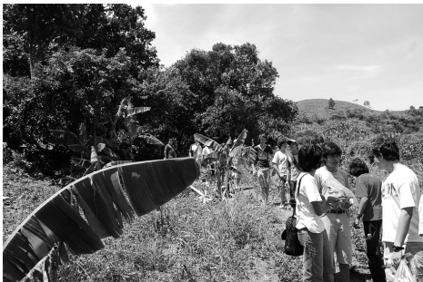
Y empezamos a caminar

Este sitio, desconocido por un alto porcentaje de los estudiantes causó un gran impacto, especialmente después de la narración de lo sucedido por parte de un guía, quien a su manera y combinando realidad con algo de ficción, hizo conmover a un auditorio flotante.