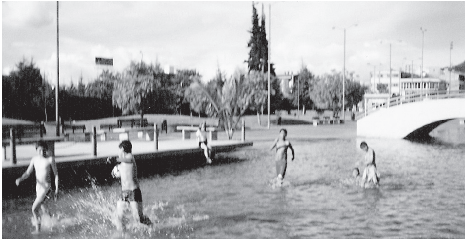
Foto: Una tarde en el parque El Renacimiento.