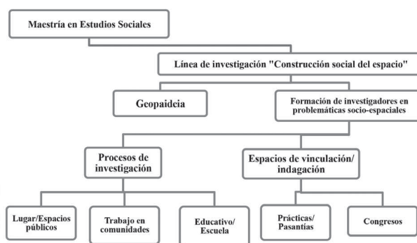
Figura 1: Estructura general de la línea Construcción Social del Espacio Maestría en Estudios Sociales – UPN

La riqueza de divulgar el trabajo que se desarrolla desde la línea de investigación CSE 5 radica en la posibilidad de hacer ejercicios comparativos con otras comunidades afines que también trabajan con problemas socio-espaciales de interés actual. En lo que se refiere al plano de las pasantías (ya sean en el ámbito local o en el exterior) tener la oportunidad de incursionar en otros espacios, permite pensar el problema de investigación desde nuevas perspectivas que incluyen no solo revisar documentación específica a la cual no se tiene fácil acceso, sino obtener retroalimentación desde otros campos disciplinares y perspectivas de docentes – investigadores expertos en campos de indagación afines.