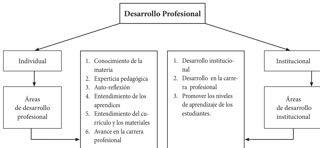
Gráfica 1. El desarrollo profesional, según Richards & Farrell (2005).

Obsérvese que este modelo presenta dos dimensiones: una en el ámbito de lo individual y la otra en lo institucional. En relación con lo institucional es justo precisar que usualmente la intención de una institución al promover PDP para sus docentes está ligada a la mejoría de la entidad en los tres dominios que se esbozan en la gráfica: el desarrollo de la institución, de los docentes y de los estudiantes. La inserción del segundo dominio inmediatamente establece una conexión con la primera dimensión: la individual, en la que las áreas de desarrollo profesional se centran en el docente, sin olvidar que existen los estudiantes (entendimiento de los aprendices) y una institución (entendimiento del currículo) representada en un currículo. Aunque no siempre las instituciones auspician la participación de sus docentes en PDP, la relación entre las dimensiones institución e individual es directa.