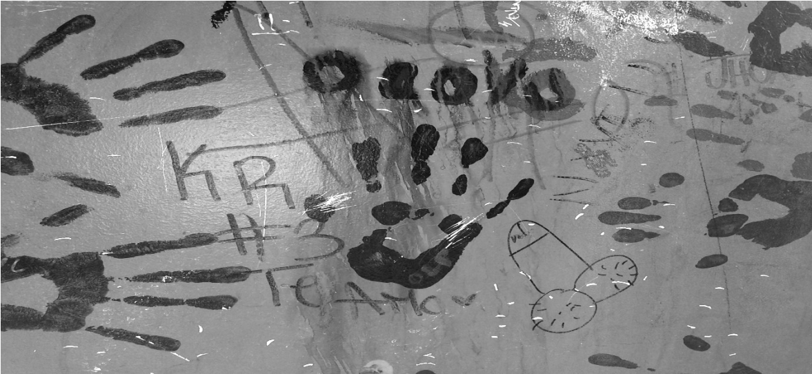
Figura 2. Enunciar lo indecible