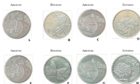
Figura 11. A e B: Moeda de 5 reais (não circulada). A) Averso: atividade de ciclismo pelo Rio de Janeiro no Parque da Tijuca. B) Reverso: Mico Leão Dourado. C e D: Moeda de 5 reais (não circulada). C) Averso: atividade de remo pelo Rio de Janeiro na Lagoa Rodrigo de Freitas. D) Reverso: orquídea. E e F) Moeda de 5 reais (não circulada). E) Averso: atividade de ciclismo pelo Rio de Janeiro no Parque da Tijuca. F) Reverso: borboleta-da-praia. G e H: Moeda de 5 reais (não circulada). G) Averso: atividade de remo pelo Rio de Janeiro na Lagoa Rodrigo de Freitas. H) Reverso: a árvore pau-brasil e, na lateral, destaque para um de seus ramos de folhas e flores.