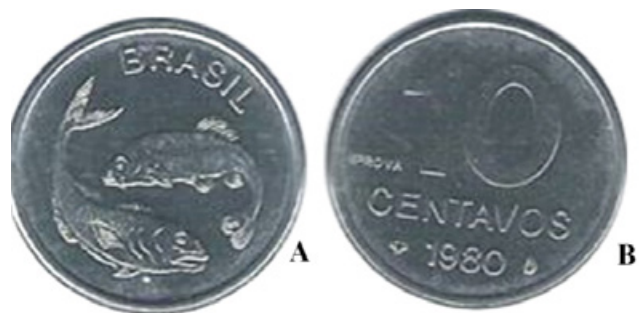
Figura 4. Moeda de 10 centavos – A) Anverso: peixes. B) Reverso.