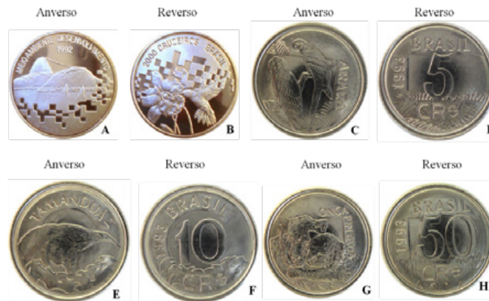
Figura 8. A e B: Moeda de 2000 Cruzeiros. A) Anverso: morros do Pão de Açúcar e da Urca, no Rio de Janeiro. B) Reverso: orquídea e beija-flor. C e D: Moeda de 5 Cruzeiros Reais. C) Anverso: duas araras. D) Reverso. E e F: Moeda de 10 Cruzeiros Reais. E) Anverso: tamanduá. F) Reverso. G e H: Moeda de 50 Cruzeiros Reais: G) Anverso: onça-pintada. H) Reverso.

Em relação as moedas que exibem os mamíferos, o professor pode trabalhar com seus alunos a relação existente entre o ser humano e a natureza e o avanço das áreas urbanas sobre os habitats naturais. O professor pode mencionar, a exemplo, as rodovias: elementos que convertem os ambientes naturais em artificiais no processo de desenvolvimento da sociedade (Guimarães et al., 2018), ressaltando o fato de que os mamíferos são os animais atropelados com maior frequência (Deffaci et al., 2016).