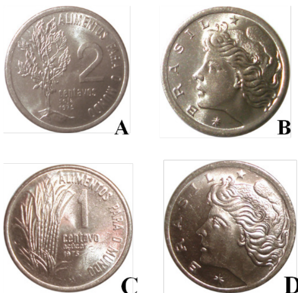
Figura 5. A e B. Moeda de 2 centavos – A) Anverso: Ramos de feijão e soja. B) Reverso. C e D: moeda de 1 centavo – C) Anverso: Cana-de-açúcar. D) Reverso.