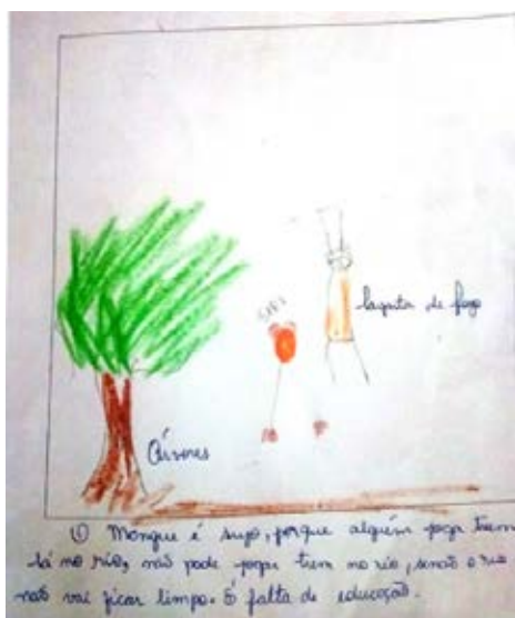
Figura 4: Desenho 3