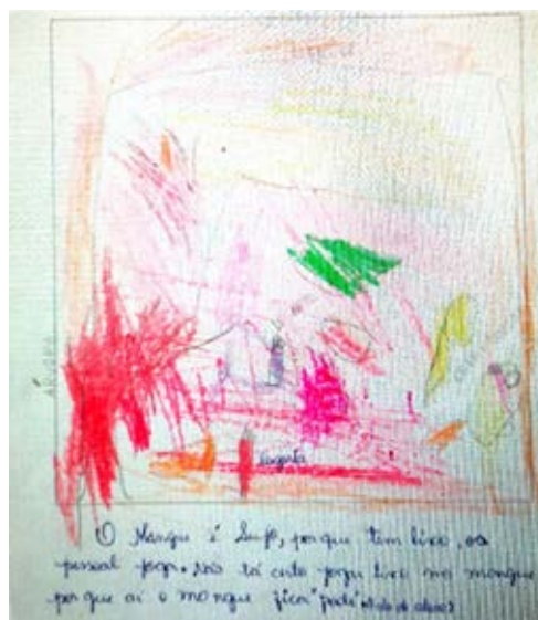
Figura 3: Desenho 2