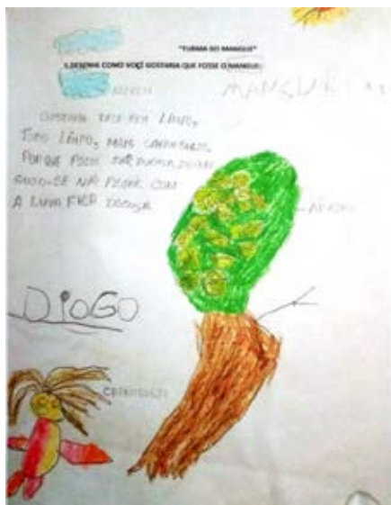
Figura 2: Desenho 1

Os desenhos das crianças (Figuras 2, 3, 4 e 5) realizados sobre aspectos relacionados ao mangue, que fica no fundo da casa e da escola, apresentam em comum a paisagem do mangue com árvores, nuvens, sol, caranguejo, pessoas, lixo e rio. Outro aspecto muito presente nos desenhos foi o lixo no mangue, o que indica a percepção delas sobre o ambiente manguezal.