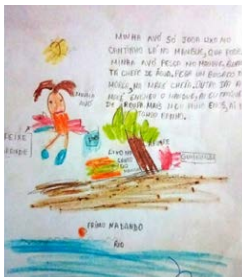
Figura 5: Desenho 4