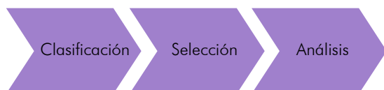
Figura 1. Desarrollo metodológico de la revisión documental.