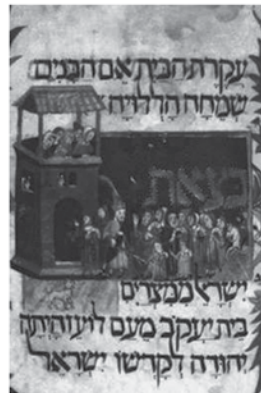
Figura 2. Pintura antes de la perspectiva. Panel inicial del Salmo de la Hagadá de Kaufmann. España finales del siglo XIV. Observe que las líneas del balcón parecen no converger

El problema inicial era ¿cómo dibujar en el papel algo que ven mis ojos? El primer paso en tratar de encontrar leyes que resolvieran este problema lo dieron los pintores. Por ejemplo, el artista Leon Battista Alberti (1404-1472) y el ingeniero y arquitecto Florentino Filippo Brunelleschi (1377-1446) desarrollaron métodos y una teoría matemática de la perspectiva seguida por los pintores de renacimiento 5 .