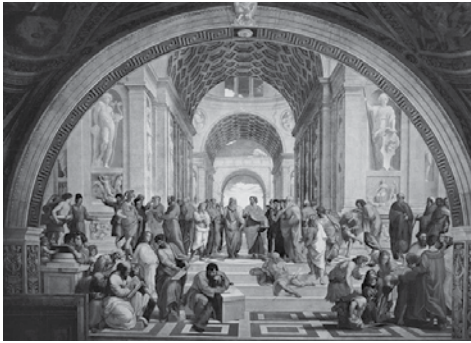
Figura 3. Pintura después de la perspectiva. Observe que las líneas superiores de los muros verticales parecen converger a un punto

Para comprender mejor un dibujo en perspectiva, primero veamos la proyección de un objeto sobre un plano.