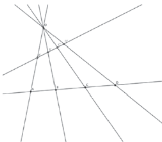
Figura 5. Las razones dobles son iguales (A, B; C, D) = (A', B'; C', D') = 1,35 .

Podemos dividir los puntos del plano proyectivo en dos clases, los puntos propios y los impropios. Los primeros son aquellos que su tercera coordenada homogénea es diferente de cero, mientras que los segundos los que tienen su tercera coordenada homogénea igual a cero. Note que una homografía puede llevar un punto propio a uno impropio y viceversa.