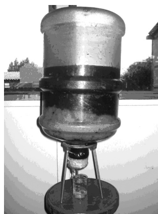
Figura 5. Filtro construido.

El filtro de mayor tamaño fue construido, manteniendo las proporciones de la composición seleccionada (véase figura 5) y se empezaron a realizar los ensayos correspondientes a la velocidad de paso en el filtro. Se tomó tiempo y volumen de agua filtrada, haciéndose evidente un flujo lento, por lo que fue necesario revisar el orden en el empaquetamiento del filtro; sin embargo, luego de empaquetar en diferente orden tres filtros de prueba y observar las muestras filtradas se mantuvo el orden y la composición definida inicialmente, al no mejorar estas condiciones el flujo.