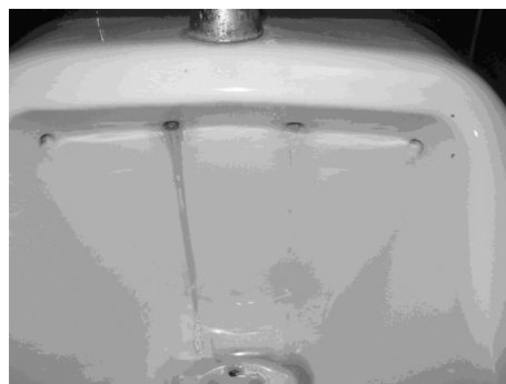
Figura 1. Manchas dejadas por el agua en el material de laboratorio y en la cerámica sanitaria.