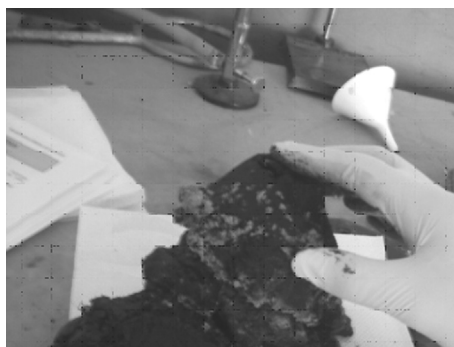
Figura 2. Construcción del filtro seleccionado.