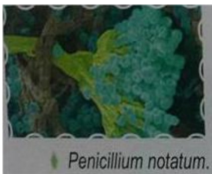
Penicillium notatum .