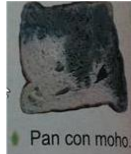
Pan con moho.