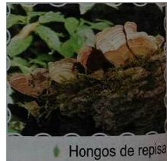
Hongos de repisa.