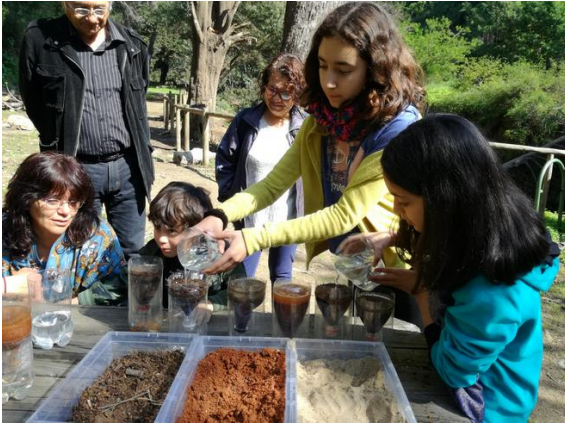
Fig. 12. Estación 6