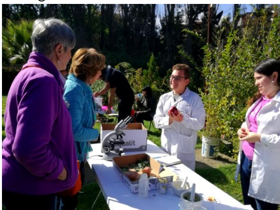
Fig. 10. Estación 5