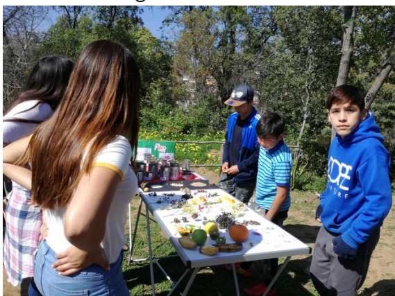
Fig. 2. Estación 1