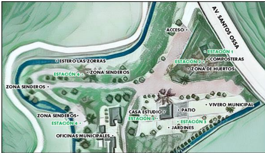
Figura 1: Mapa del Parque y ubicación de las estaciones curriculares.