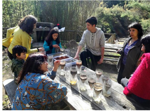
Fig. 13. Estación 6