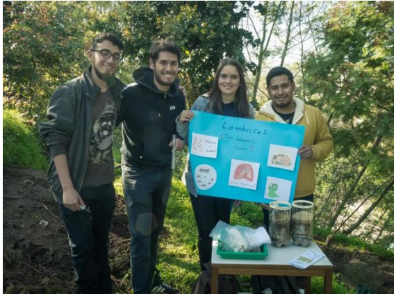
Fig. 4. Estación 2