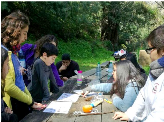
Fig. 8. Estación 4