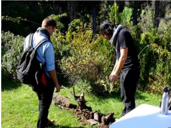
Fig. 6. Estación 3