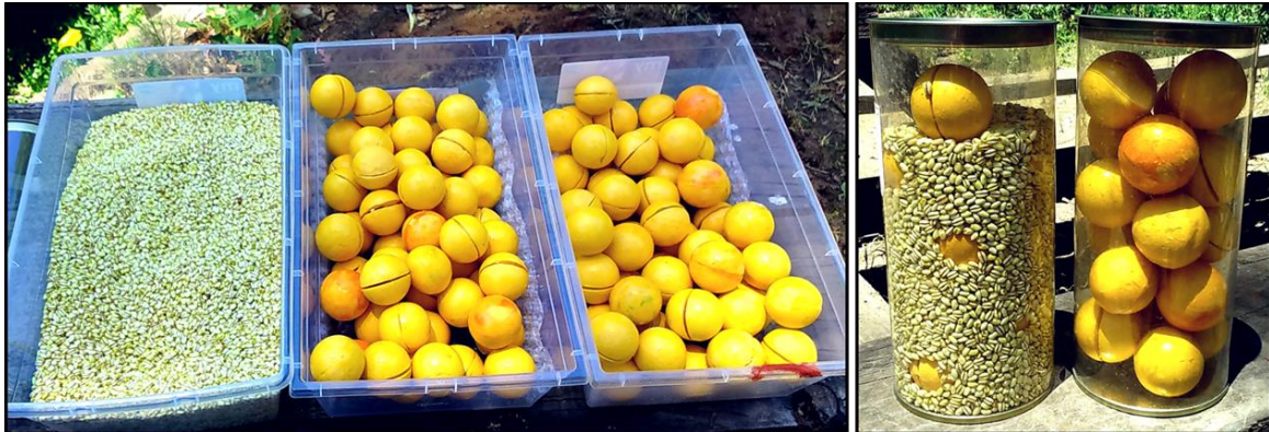
Fig. 18 y 19. Taller para profesores en ejercicio.