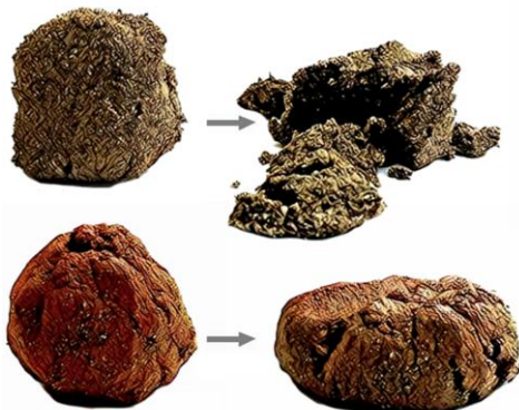
Fig. 14. Determinación de textura al tacto.