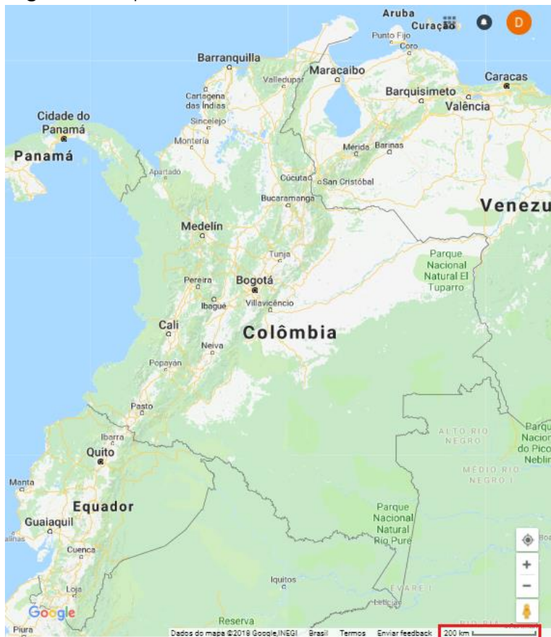
Figura 2: Mapa da Colômbia

1º Passo: Pesquisar, no Google Maps, o mapa da região a ser calculada e captar a imagem, conforme apresentamos na figura 2, por meio da função Print Screen do computador. Após transferir a imagem para o editor de figuras à escolha.