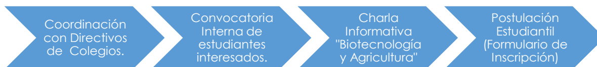
Figura 1. Plan de Acción de Convocatoria Estudiantil.

La muestra consideró a 21 estudiantes secundarios pertenecientes a Liceos Agrícolas de sectores rurales de la Región Metropolitana (Melipilla, María Pinto e Isla de Maipo). Mayoritariamente mujeres (66,7%), con un rango de edad entre los 14 y 17 años. Los estudiantes fueron invitados a participar de la Academia por medio de una Convocatoria Estudiantil (Fig 1) realizada en conjunto con cada establecimiento educacional.