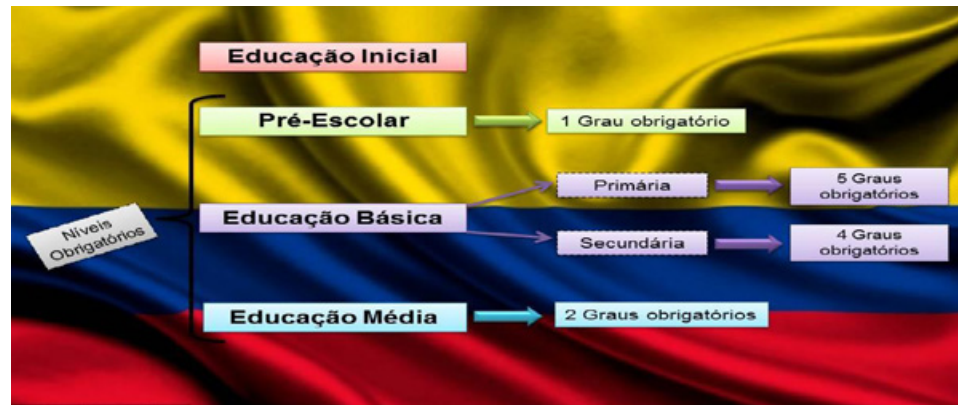
Figura 1. Resumo da organização da Educação Colombiano

p. 1). A Figura 1 traz um resumo da organização do ensino colombiano e dos seus respectivos níveis e graus que devem ser cumpridos pelos estudantes.