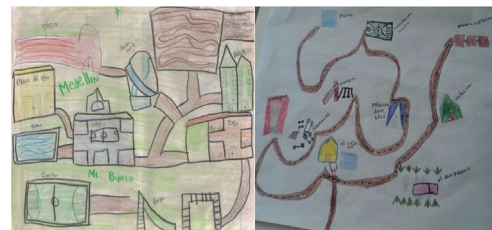
Figura 3. Mapas de la ciudad de Medellín elaborados por estudiantes del grado sexto de la IE Fe y Alegría La Cima

Los jóvenes participantes en el estudio señalaron aquellos lugares cercanos a sus afectos, sus experiencias, su familia, amigos y compañeros del colegio. Destacaron lugares que permiten el esparcimiento como los parques recreativos (Parque Norte, Parque de las Aguas y Juan Pablo Segundo) y aquellos que ofrecen entretenimiento como los cines, el circo, el Parque de los Deseos, el Parque de los Pies Descalzos, entre otros. Asimismo, se identificaron otro tipo de lugares ligados a las actividades deportivas como el estadio, la cancha de San Blas, La Unidad Deportiva de Belén, las piscinas del Instituto de Recreación y Deportes de Medellín (Inder), la pista de bicigrós, el gimnasio, las canchas de fútbol y de básquetbol, aparte de lugares lúdicos como Divercity, el Parque Explora y el Museo del Agua. A continuación, se comparten dos mapas dibujados por estudiantes participantes de la investigación donde se representan algunos de los lugares anteriormente señalados (figuras 3 y 4).