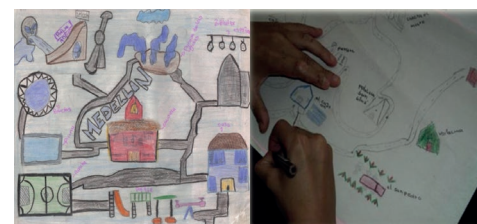
Figura 4. Mapeo de lugares cercanos por estudiantes de grado sexto