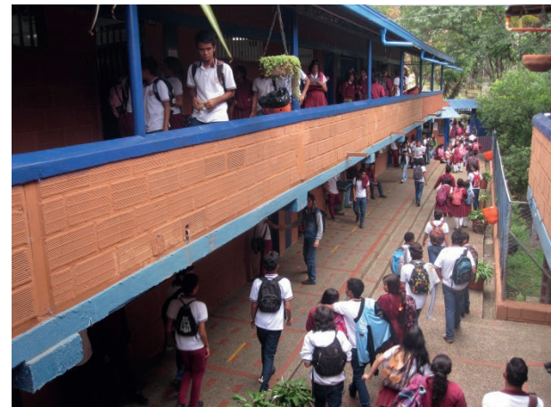
Figura 2. Infraestructura de la institución