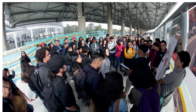
Fotografía 1. Recorrido urbano en la exposición fotográfica Bogotá sobre ruedas , Portal Tunal de Transmilenio

Ahora bien, con el fin de transmitir las diversas experiencias de observación en estos barrios de la periferia sur de Bogotá, en este artículo se esboza, en primer lugar, una trayectoria urbana de Ciudad Bolívar en relación con el origen de sus barrios. Luego, se caracteriza la localidad desde la perspectiva de la producción espacial de la desigualdad, además de abordar la tensión entre la visión comunitaria y la visión institucional en el proyecto de cable aéreo. Por último, se presenta una integración entre lo teórico y lo práctico en la observación del paisaje urbano y en su relación con el fenómeno de turistificación .