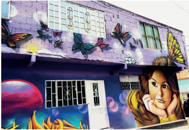
Fotografía 3. Murales en el barrio El Paraíso

Los turistas extranjeros han llegado recientemente para recorrer estas calles en busca de una experiencia urbana motivada por los contrastes sociales y el aparente acceso a la vida cotidiana de estos barrios miradores. Además, el arte urbano, los tipos de construcción y la oferta comercial permiten a estos nuevos visitantes caminar y explorar, a la vez que algunos vecinos intentan diseñar emprendimientos en busca de ingresos económicos. Un ejemplo de esto son los recorridos barriales, organizados por una habitante de la zona, que ofrecen todo un paseo por el barrio acompañado de experiencias recientes y pasadas que se encuentran marcadas por el conflicto de pandillas y las calamidades familiares. Otros ejemplos son las nuevas panaderías, los puestos de comidas rápidas, un local de artesanías y un hostel.