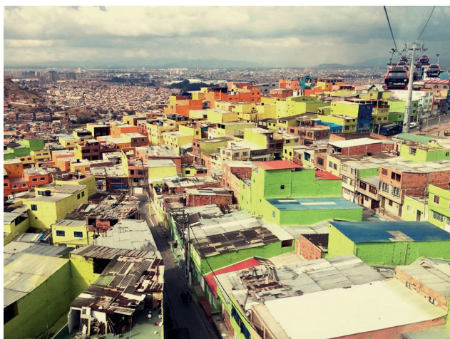
Fotografía 2. Vista desde la línea de TransMiCable

En relación con estas intervenciones, es necesario reconocer que los paisajes emergentes se presentan en el contexto de un cambio espacial ligado a una contribución cultural —ya sea impuesta o negociada— que marca y delimita las relaciones sociales. Sin embargo, el significado y demarcación del espacio no es de manejo exclusivo de los habitantes de los barrios, también el transeúnte, al percibir estas intervenciones (mensajes, códigos y símbolos), puede dar nuevos sentidos a las formas de habitar. Esta estigmatización urbana se une a la segregación heredada y a la pobreza estructural, lo que produce cambios en el paisaje y en el imaginario urbano sobre las personas y los lugares de la difundida ciudad de colores que oculta la marginalidad.