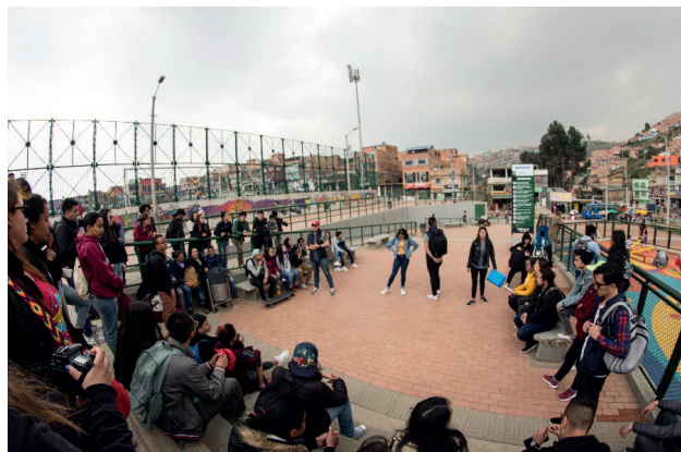
Fotografía 5. Visita al Parque Zonal Illimani, barrio El Paraíso

Con las transformaciones espaciales se complejizan las formas culturales espacializadas que se expresan en distintos niveles de racionalidad espacial en relación con la vida cotidiana. Estos cambios en la espacialidad y en las prácticas cotidianas pueden fortalecer el sentimiento de comunidad o, por el contrario, reproducir la desigualdad en lo político, lo territorial y lo económico. La gestión urbana que privilegia la revitalización morfológica con fines especulativos y subestima la trayectoria de la gestión local, seguramente se enfrentará a la complejización de la segregación urbana y transitará a nuevas expresiones, por ejemplo, del fenómeno de turistificación . Este, lejos de inscribirse exclusivamente en las ciudades de los países desarrollados, se plantea como evidencia de la alta permeabilidad del modelo neoliberal en las ciudades fragmentadas y desiguales, en este caso activada por el despliegue paisajístico de la pobreza, la marginalidad y la segregación.