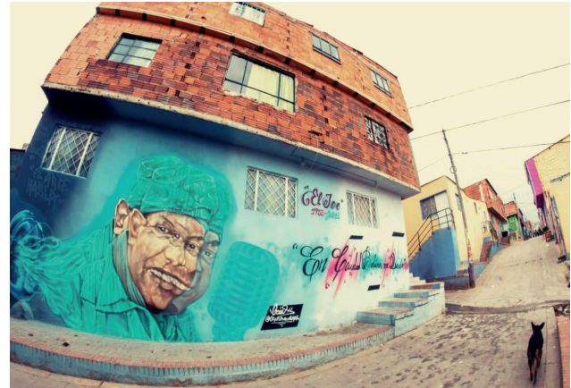
Fotografía 4. Murales en el barrio El Mirador

Es la participación de sus habitantes, con sus imaginarios, memorias y capacidad de organizarse, lo que configura y transforma el territorio, dándole una identidad propia, de cara al presente y al futuro que ya se manifiesta con todas las transformaciones de índole social, económica y cultural. (Fierro y Suárez, 2019, p. 18).