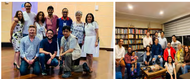
Figura 2. Integrantes de Geopaideia, Colômbia