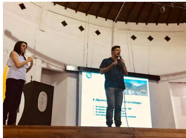
Figura 4. Integrantes do grupo Geopaideia