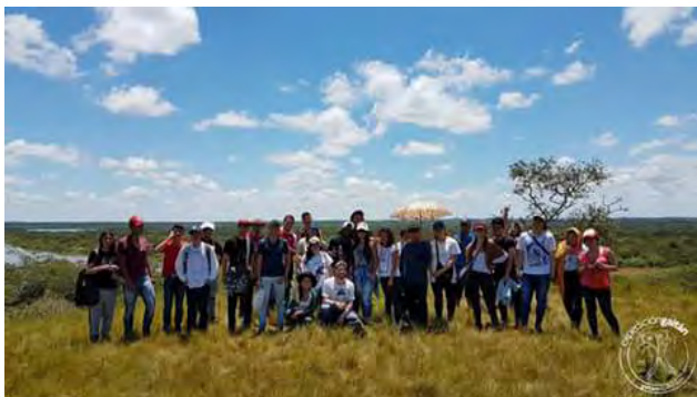
Figura 3. Saída de campo

Compreende-se que o aluno pode aprender na interação com os lugares, considerando-se o lugar e os contextos. Vai além de ser instrumento, o que inova e sugere a possibilidade de viver ou aprender na vida cotidiana. Oportuniza a possibilidade de interiorizar as próprias ações, considerando o que é forte e o que é fraco, de modo a construir um olhar crítico-reflexivo que gere documentos para contribuir com melhorias. Tem como metas: a) construção de uma reflexão e leitura crítica; b) sistematizar a experiência de vida e ressignificar o trabalho realizado; c) contribuir para formação de seminários de investigação. A metodologia centra-se na sistematização que diz de buscar a observação e reflexão como campo de saber na formação, o que encaminha a construção e um conhecimento rigoroso para capacitar a ação transformadora.