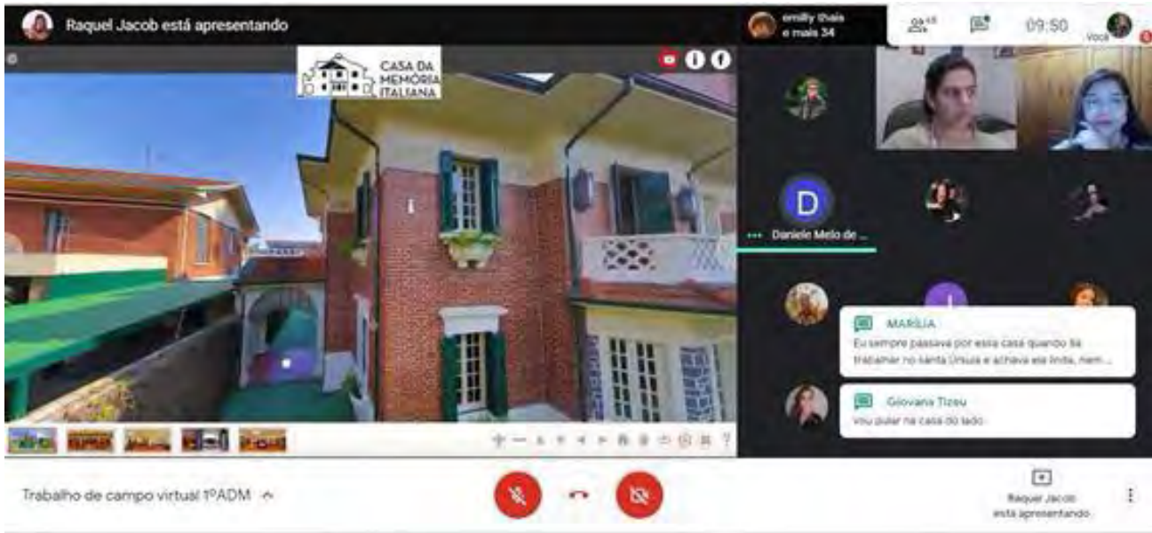
Figura 3. Imagem da plataforma durante o trabalho de campo virtual