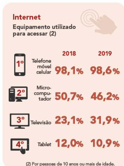
Figura 1. Equipamentos utilizados para acesso à internet no Brasil.

Conforme a Pesquisa Nacional por Amostra de Domicílios (PNAD) de 2019, feita pelo Instituto Brasileiro de Geografia e Estatística (IBGE), 82,7% dos domicílios nacionais possuem acesso à internet. Porém, somente o acesso à internet não garante acesso ao ensino remoto. Conforme mostra a Figura 1, 98,6% o acesso à internet é feito pelo celular, o que dificulta o acesso às aulas remotas. O levantamento do IBGE mostra também, que 12,6 milhões de domicílios ainda não têm internet.