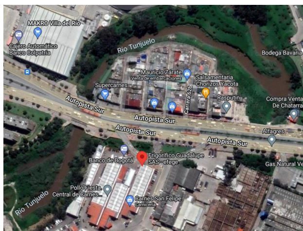
Ilustración 2. Mapa del barrio Guadalupe.

La historia de los territorios está perdida en muchas oportunidades. Este es el caso de Guadalupe: un pequeño barrio 1 , que hace parte de la localidad de Kennedy, al suroccidente de Bogotá, rodeado por el río Tunjuelo en una medialuna al norte y la Autopista Sur, que hace las veces de frontera entre las localidades de Kennedy y Tunjuelito (ver Ilustración 2). Cuando se recorre la ciudad por la Autopista Sur, el sector es inmediatamente reconocible por su principal actividad, ya que este lugar concentra gran parte de la comercialización de productos cárnicos de Bogotá 2 , derivado de su proximidad con el Frigorífico Guadalupe (ver Ilustración 2), que se encuentra ubicado al sur del barrio, en la localidad de Tunjuelito. Es tal la influencia del frigorífico sobre el barrio, que de éste es donde proviene su nombre.