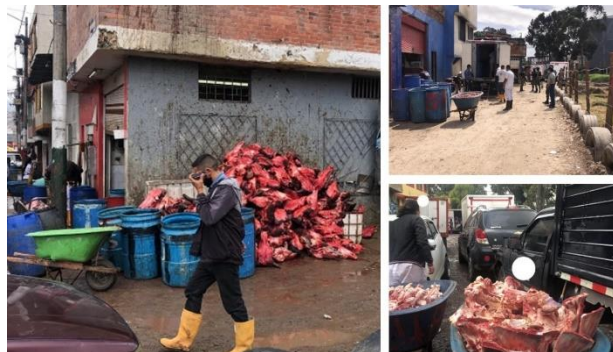
Ilustración 3. Manejo de cárnicos en el barrio Guadalupe en la zona identificada como de riesgo alto, en la periferia del sector, colindante con el río Tunjuelo.

No obstante, los problemas sanitario-ambientales son los que mayor impacto tienen en el sector. Consecuencia de la actividad comercial, las condiciones de disposición y venta de cárnicos, es muy irregular, lo que ha derivado en que Guadalupe sea considerado como un punto crítico de contaminación en la ciudad. Así, se han identificado prácticas sanitarias y ambientales riesgosas, como deficiente manipulación de la carne en tanto se detectaron: ruptura de cadena de frío, disposición de cárnicos en canecas o carretillas, exposición de la carne a cielo abierto, e incluso, su disposición en el suelo sin ningún tipo de barrera física (ver Ilustración 3).