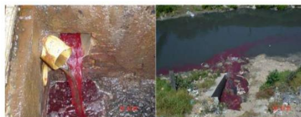
Ilustración 4. Vertimientos de sanguaza al río Tunjuelo.

Relacionado con lo anterior, los vertimientos de sanguaza 8 al río Tunjuelo (ver Ilustración 4) son otra fuente de grave contaminación del afluente (Comisión Ambiental Local de Kennedy, 2021; Secretaría Distrital del Medio Ambiente, 2007). Junto con lo anterior, la disposición de residuos sólidos es otro problema de especial atención, ya que no existe un lugar apropiado en el barrio para este fin, produciendo que se arrojen sobre la autopista sur, al aire libre, donde se acumulan; o que sean desechados en la ronda del río. Muchos de estos desechos son peligrosos por tratarse de cabezas, huesos, u otros subproductos cárnicos.