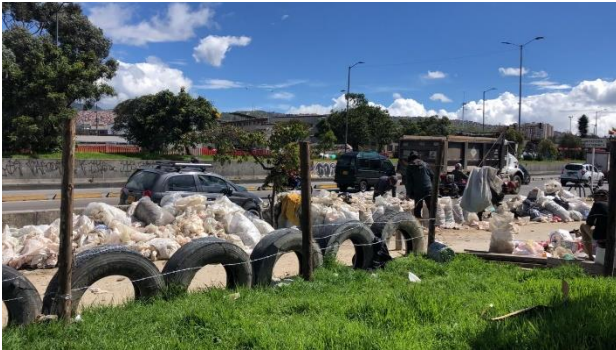
Ilustración 5. Lugar de disposición de desechos sólidos sobre la Autopista Sur.