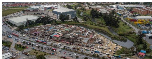
Ilustración 1. Vista aérea del barrio Guadalupe, anterior a su intervención en 2020.

Este artículo se estructura en tres apartados. El primero, hace una revisión de la historia y las prácticas ambientales del barrio Guadalupe, el segundo apartado identifica las problemáticas y conflictos ambientales del sector; y el tercero, explica cómo se llevó a cabo la implementación de la Acción Popular 520 de 2002 en el barrio Guadalupe, así como una muestra de los logros y retos de este proceso. El artículo cierra con unas conclusiones sobre la investigación.