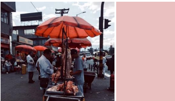
Ilustración 6. Comercio de carne en el espacio público del barrio Guadalupe.

El manejo del espacio público es otro de los problemas que han ocasionado un agravamiento de las condiciones sanitario-ambientales de la zona, ya que la venta de cárnicos a cielo abierto se ha extendido hacia el andén de la autopista sur sin la aplicación de ninguna norma sanitaria (ver Ilustración 6). Esta situación tiene sentido, vista desde la teoría, ya que el espacio público es un elemento clave en la ciudad conquistada, porque es donde se llevan a cabo las relaciones sociales, económicas y culturales de la ciudadanía (Borja et al., 2003). El espacio público se convierte así en un lugar donde los ciudadanos pueden expresarse y construir su identidad y cultura que, en el caso de Guadalupe, circunda alrededor de su actividad comercial.