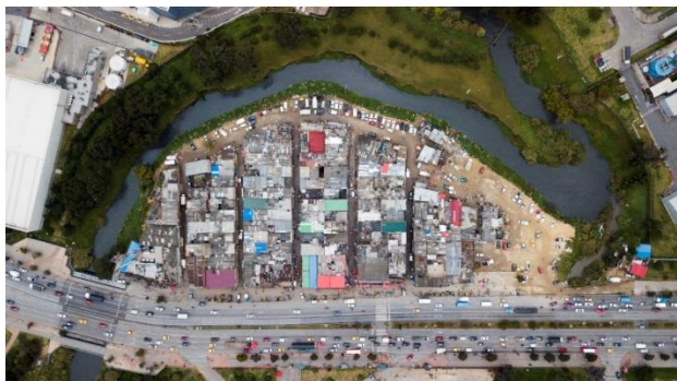
Ilustración 8. Barrio Guadalupe antes de la serie de intervenciones de la administración local, vista aérea.