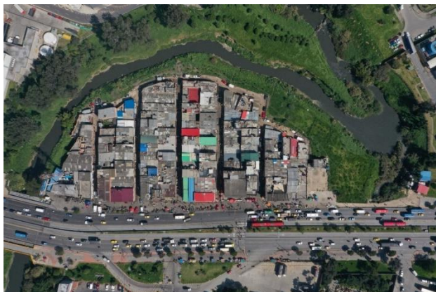
Ilustración 9. Barrio Guadalupe después de ser intervenido, 2022. Vista aérea