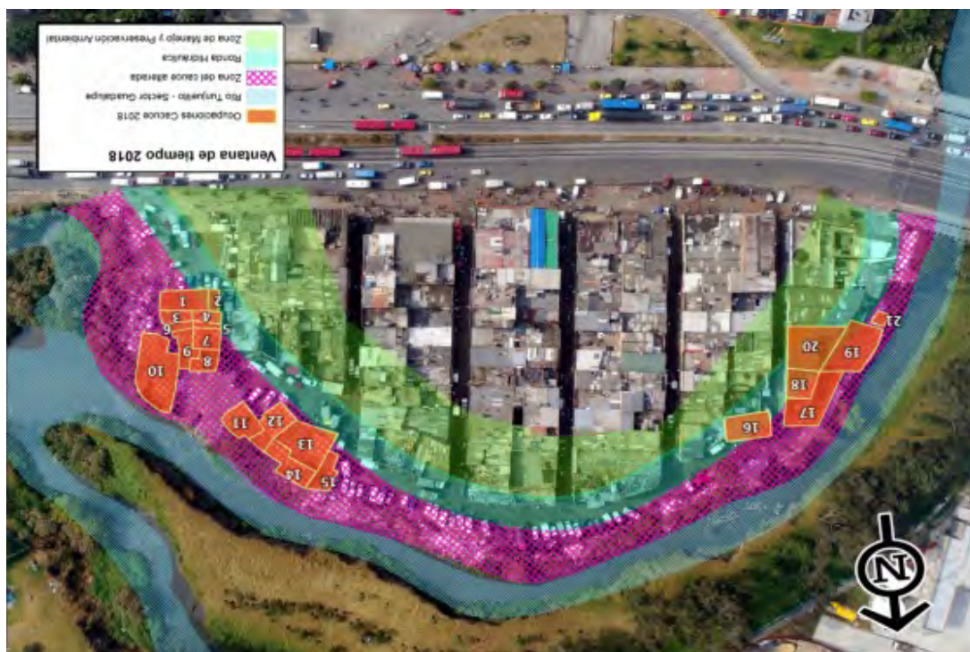
Figura 7. Mapa del barrio Guadalupe que ilustra las zonas de ronda y ZMPA del río Tunjuelo, su cauce alterado y las ocupaciones ilegales en el sector