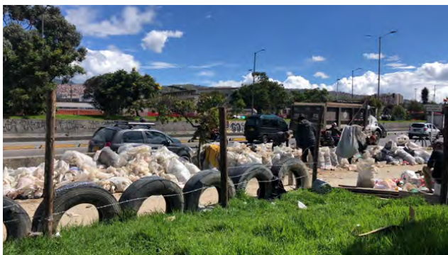
Figura 5. Lugar de disposición de desechos sólidos sobre la Autopista Sur