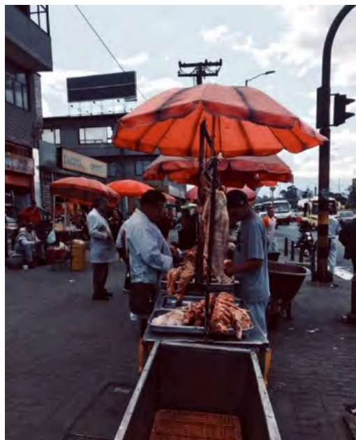
Figura 6. Comercio de carne en el espacio público del barrio Guadalupe

así en un lugar donde los ciudadanos pueden expresarse y construir su identidad y cultura que, en el caso de Guadalupe, circunda alrededor de su actividad comercial.