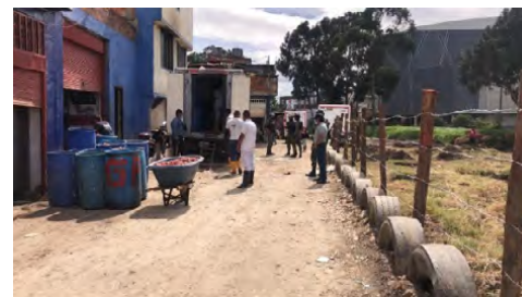
Figura 3. Manejo de cárnicos en el barrio Guadalupe en la zona identificada como de riesgo alto, en la periferia del sector, colindante con el río Tunjuelo

No obstante, los problemas sanitario-ambientales son los que mayor impacto tienen en el sector. Consecuencia de la actividad comercial, las condiciones de disposición y venta de cárnicos es muy irregular, lo que ha derivado en que Guadalupe sea considerado como un punto crítico de contaminación en la ciudad. Así, se han identificado prácticas sanitarias y ambientales riesgosas, como la deficiente manipulación de la carne, en tanto se detectaron: ruptura de cadena de frío, disposición de cárnicos en canecas o carretillas, exposición de la carne a cielo abierto, e incluso, su disposición en el suelo sin ningún tipo de barrera física (figura 3).