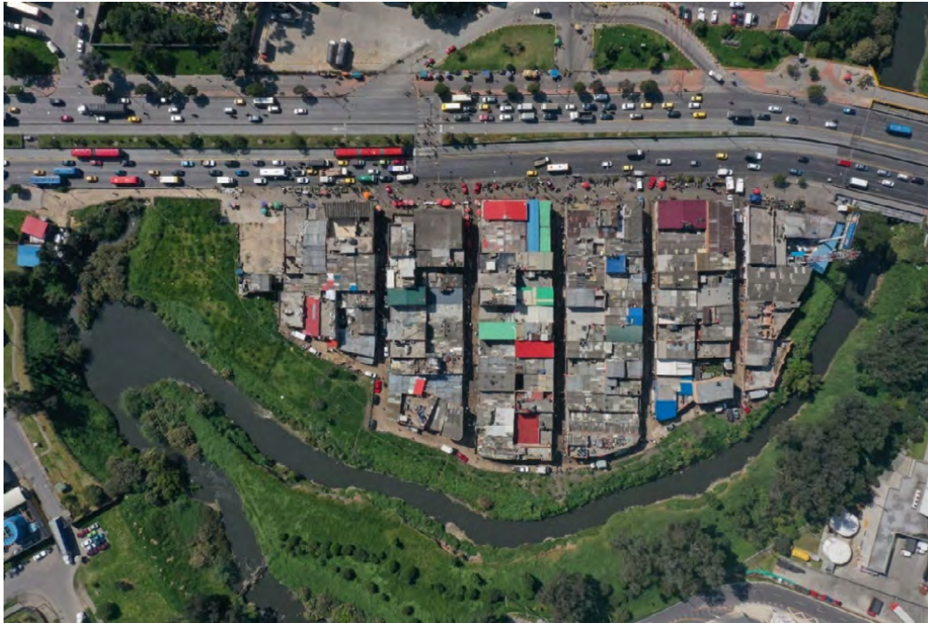
Figura 9. Barrio Guadalupe después de ser intervenido, 2022. Vista aérea