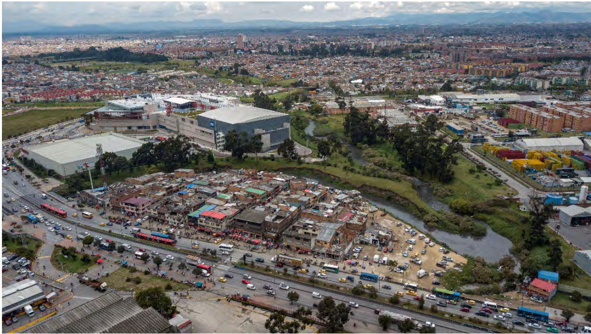
Figura 1. Vista aérea del barrio Guadalupe, anterior a su intervención en 2020