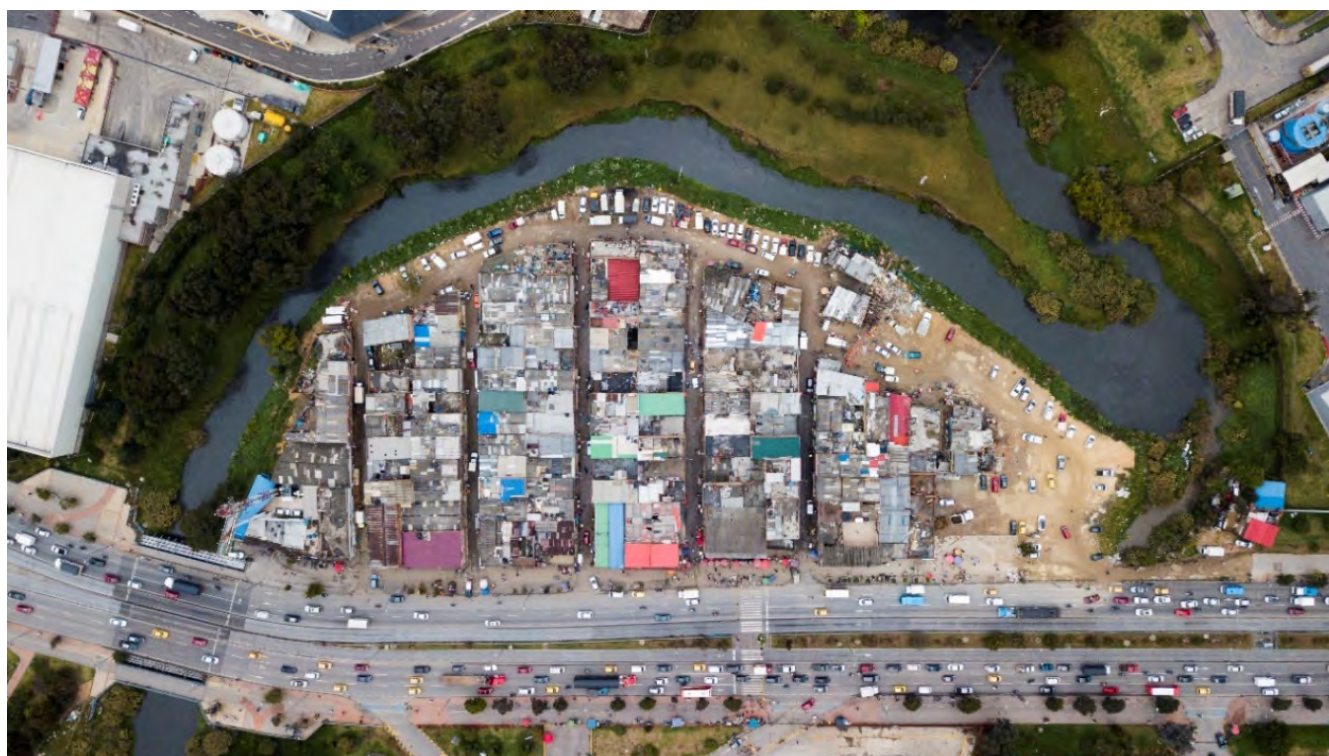
Figura 8. Barrio Guadalupe antes de la serie de intervenciones de la administración local, vista aérea