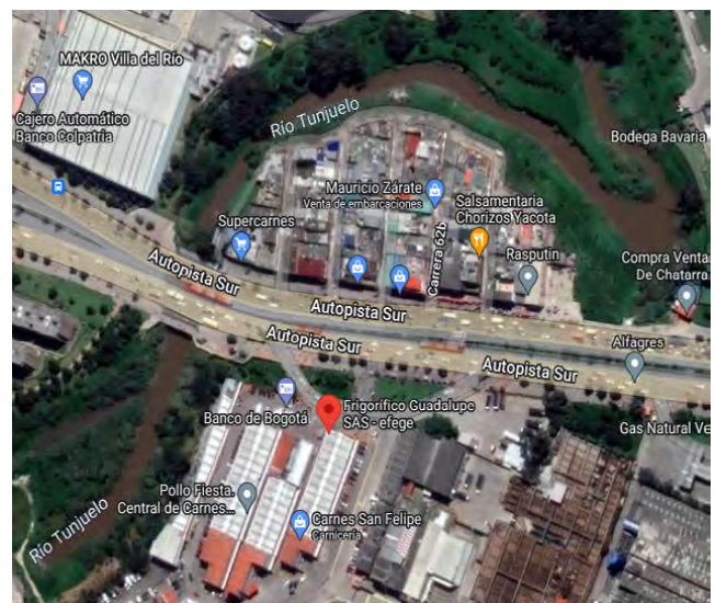
Figura 2. Mapa del barrio Guadalupe