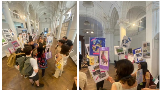
Figura 3. Visitantes interactuando con la instalación móvil.

La instalación móvil interactiva que presentamos ofrece imágenes y textos breves que buscan dar cuenta de las transformaciones en los enfoques disciplinares y epistemológicos incorporados en las definiciones de los contenidos escolares de la geografía, así como del surgimiento de nuevas miradas y del tratamiento de nuevos procesos socio-territoriales. El móvil está conformado por unos 30 carteles de tamaño A4, doble faz, que "flotan" en el espacio de la exhibición permitiendo la circulación de los visitantes entre los mismos (Figura 3). Los distintos carteles fueron el resultado de un proceso de producción colaborativa y artesanal, llevado a cabo por estudiantes de 6to año del nivel secundario en el marco de sus clases de geografía. 3 Se utilizaron distintas técnicas de ilustración: collage, dibujos, fotografías intervenidas, distintas tipografías, entre otras.