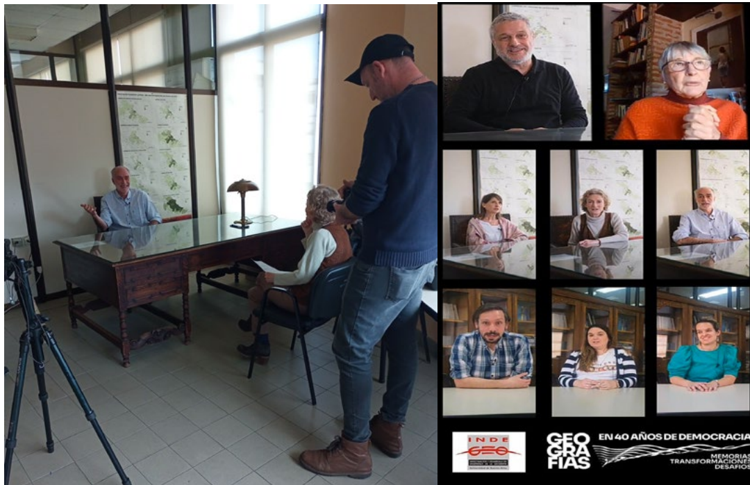
Figura 1. Filmación del video.

que surgían por parte de los entrevistados hicieron posible recuperar retazos de la memoria colectiva y de la identidad personal y generacional de los profesores y estudiantes participantes (Figura 1). La posibilidad de hacer público el paso por las aulas de la Facultad de Filosofía y Letras en estos 40 años permitió dejar huellas de esa historia y hacer vínculo entre la intimidad y la esfera pública, a partir de la transición democrática.