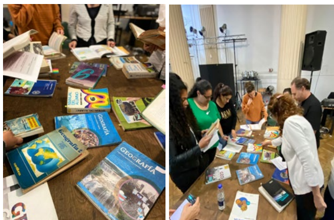
Figura 6. Taller de libros de texto.

Con diversos grados de implementación y desarrollo, quienes hoy son estudiantes del profesorado o jóvenes graduados han estudiado una geografía que se reconoce como ciencia social y han tenido la oportunidad de estudiar temáticas socio-territoriales y ambientales, tanto en la formación secundaria como superior. En este sentido, el taller permitió para los jóvenes que se acercaron una reposición de los paradigmas en juego en las etapas de referencia, de los currículos y una interpretación de las visiones de la geografía escolar plasmada en los libros de texto. Un aporte para aproximarse a las transformaciones, los cambios y las continuidades con sus resignificaciones, que quizás sin conocer los libros de la pre-democracia no alcanzaban a dimensionar.