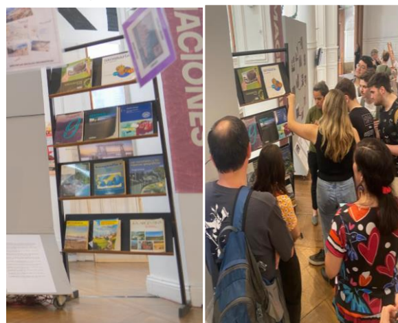
Figura 2 Exhibición de los libros en la muestra

La selección de los manuales para la muestra nos llevó a un encuentro con esa Geografía escolar, a comparar formatos y perspectivas e identificar qué representaciones del mundo y del país comunicaban. La exhibición busca dirigir la atención hacia estas Geografías enseñadas en dos grandes etapas: una anterior a 1983 y otra correspondiente al período democrático. Tal como se mencionó anteriormente, el objetivo consistió en acercar a los visitantes a los cambios y permanencias observados en los índices temáticos, en los contenidos de los capítulos, en las actividades propuestas, en los recursos e imágenes proporcionadas (Figura 2).