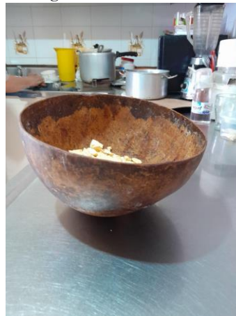
Figura 3. Herencias. Totuma