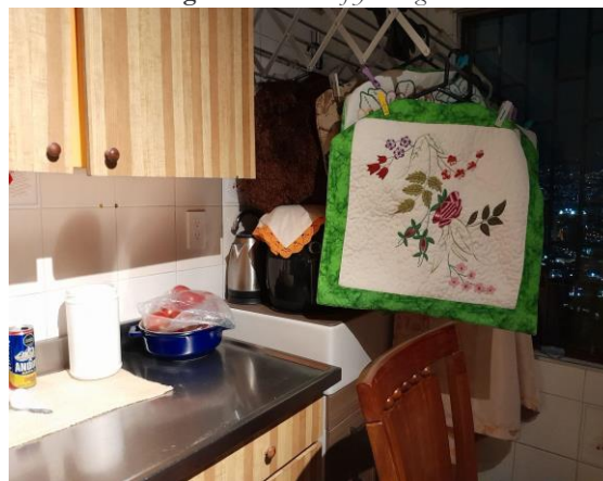
Figura 2. Olla Airfryer relegada.