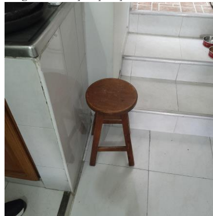
Figura 5. Banquito para permanecer en la cocina