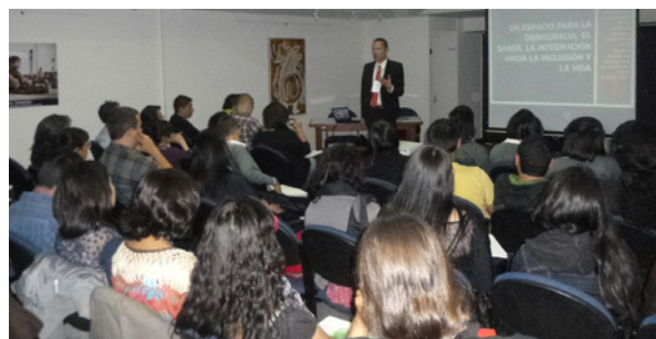
Foto 7. Ejemplos de ponencias realizadas.

Fuente: archivo del grupo de investigación.