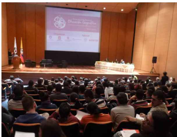
Foto 1. Apertura de la Tercera Convención Nacional de Educación Geográfica.