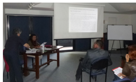
Fotos 14 y 15. Ejemplos de experiencias educativas presentadas.