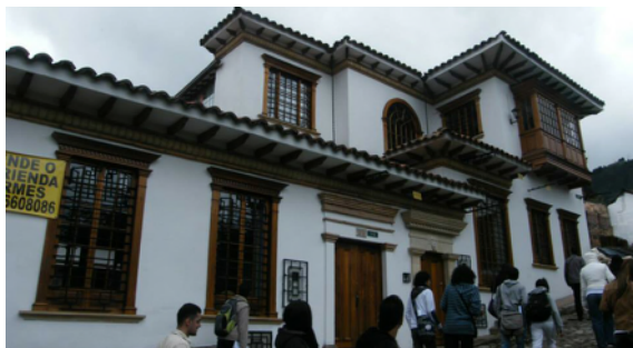
Fotos 12 y 13. Recorrido urbano en el centro histórico de Bogotá.

De acuerdo con lo mencionado anteriormente, el Boletín informativo (2014) considera que una de las actividades más sobresalientes de la convención es la realización de algunos recorridos urbanos por diferentes lugares de Bogotá (fotos 10 y 11), lo cual reitera la intencionalidad del grupo Geopaideia de repensar la salida de campo en cuanto a sus aportes a la educación geográfica y la necesidad de su fortalecimiento en los contextos escolares. Así,