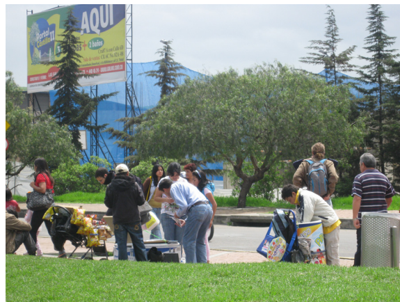
Fotografía 3. Confluencia de actividades realizadas por los sujetos-habitantes de El Tintal.

Los significados hacia el escenario de lo público producidos por los sujetos-habitantes que actúan y ejercen un acto de presencia rescatan en el sector funciones de tipo recreativo, de esparcimiento y de movilidad para la ciudad. Además de ello, la zona presentada les ofrece varios servicios, articulados con el desarrollo de sus actividades (placenteras o laborales), constituyéndose como punto de referencia socioespacial tanto a nivel comercial como de descanso y esparcimiento.