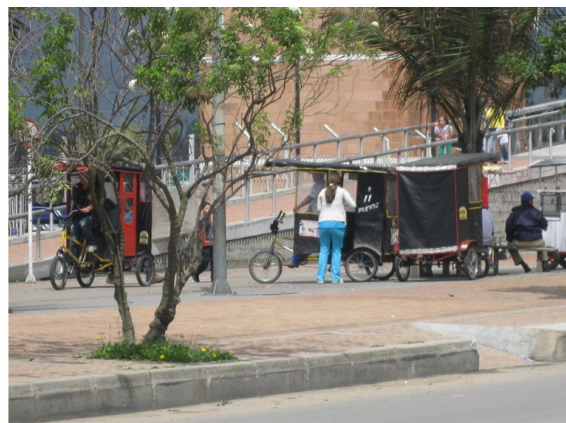
Fotografías 4 y 5. Contraste entre zonas donde se desarrollan actividades informales.

La forma como se establecen limitantes a la acción viene dada por el conocimiento previo sobre las zonas en las que se pueden o no desarrollar ciertas prácticas. La experiencia espacial es un elemento primordial para reafirmar que la construcción de lugares se vincula con el desarrollo de territorialidades que expresan la pertenencia y la apropiación hacia el espacio, lo cual es el resultado de la capacidad del sujeto para cambiar situaciones que afectan el desarrollo de sus actividades cotidianas en situaciones favorables para sí. Esto conduce a afirmar que cada sujeto se encarga de articular sus prácticas cotidianas conforme le es posible actuar en espacios, contextos y situaciones específicas, teniendo presentes unos mínimos necesarios para la convivencia social a partir del respeto de unos compromisos generados en el ambiente social sobre el cual se desenvuelve (ver mapa 5).