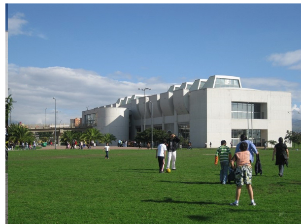
Fotografías 1 y 2. Las zonas verdes: espacios de mayor confluencia poblacional en los espacios públicos de El Tintal.