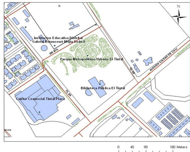
Mapa 1. Espacios públicos de la Biblioteca y el Parque Metropolitano Urbano de El Tintal. Fuente: elaboración propia.

En estos espacios públicos se analizaron formas de interacción humana a través de la constitución de lugares para el habitar. Se pretendió identificar, entre diversas prácticas sociales de los sujetos que habitan estos escenarios, formas de interpretar y concebir los espacios vividos desde la subjetividad a partir de un interrogante central: ¿cómo las prácticas sociales, desarrolladas por los sujetos que habitan la Biblioteca Pública y el Parque Metropolitano Urbano de El Tintal, contribuyen a la construcción de lugares para la socialización y el ejercicio de la ciudadanía desde la apropiación de sus espacios públicos? (ver mapa 1).