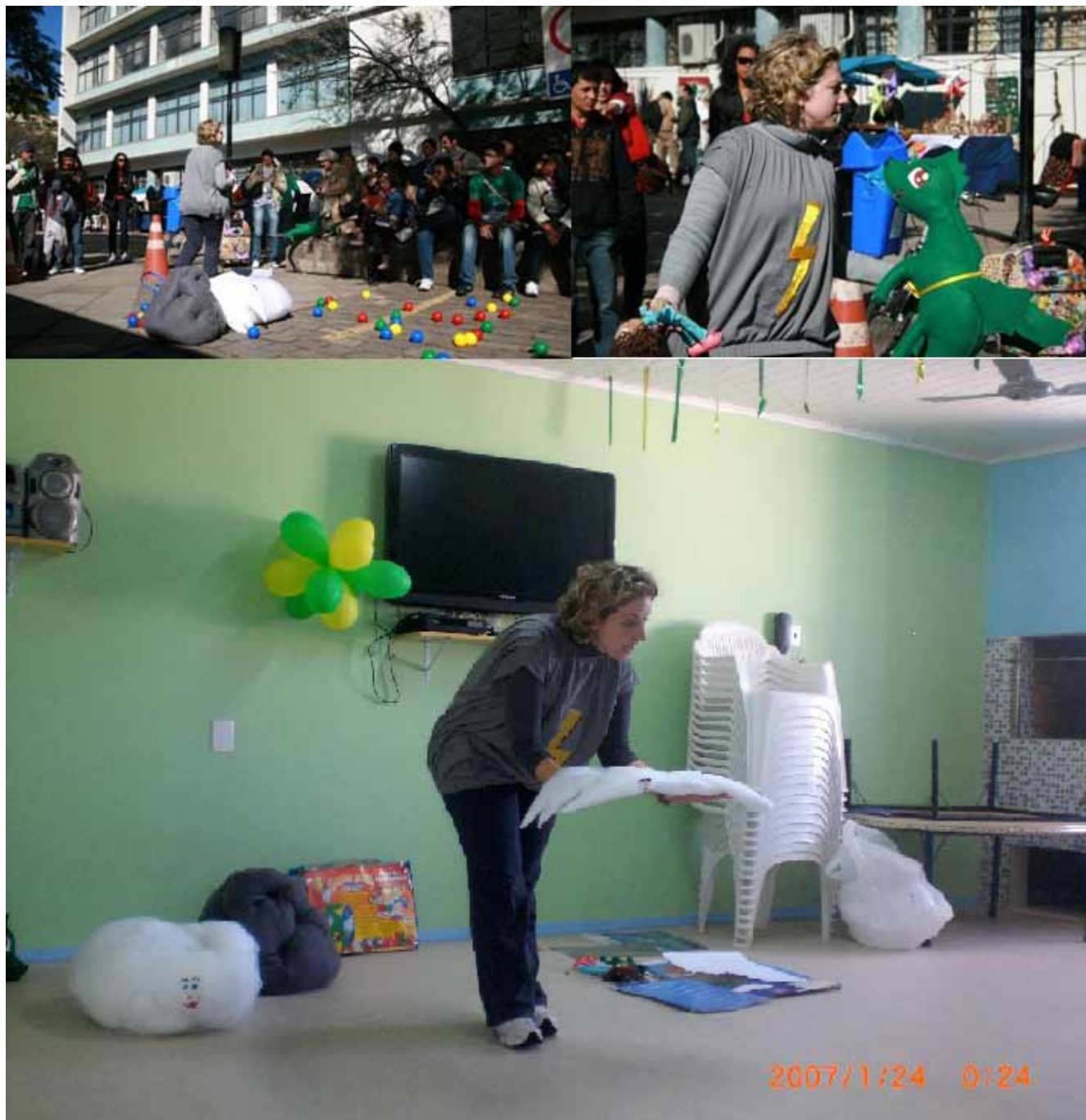
Figura 4. Contação de histórias para professores – XVI Encontro Nacional de Geógrafos e em sala de aula. Porto Alegre, 2010.

guntas, apreendendo através do toque nos objetos e observando suas formas e funções. Os conceitos trabalhados na história, além dos relativos ao espaço, aos planetas, ao movimento da Terra, aos dias e às noites são associados, também, ao clima, aos tipos de nuvens e à origem das chuvas.