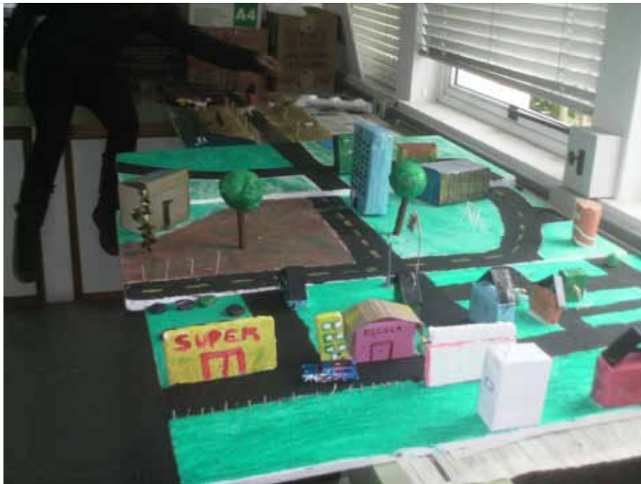
Figura 1. Exemplo de maquete produzida pelas crianças inscritas no projeto: Educação ambiental – Vivências no urbano. Extraído do relatório de Kornalewski da Silva. (PIBIC/FAPERGS, 2008) Inédito.

Análise e reflexões. Nesta fase, os alunos envolvidos nas atividades promoveram um debate e elaboraram reflexões sobre os elementos que o grupo considerou importantes na construção do bairro (Figura 2a), construindo através de suas práticas e discussões coletivas o conceito de ambiente, distinguindo este conceito daquele de natureza. (Figura 2b.)