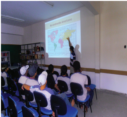
Foto Nº1: Apresentação de slide com conteúdos de cartografia escolar aos alunos da rede pública em Seropédica.

A primeira oficina mencionada teve ênfase em “alfabetizar” cartograficamente os alunos do 7º ano em virtude dos mesmos no ano de 2011 terem tido uma deficiência no aprendizado da disciplina de geografia pela falta de professor no primeiro bimestre letivo.