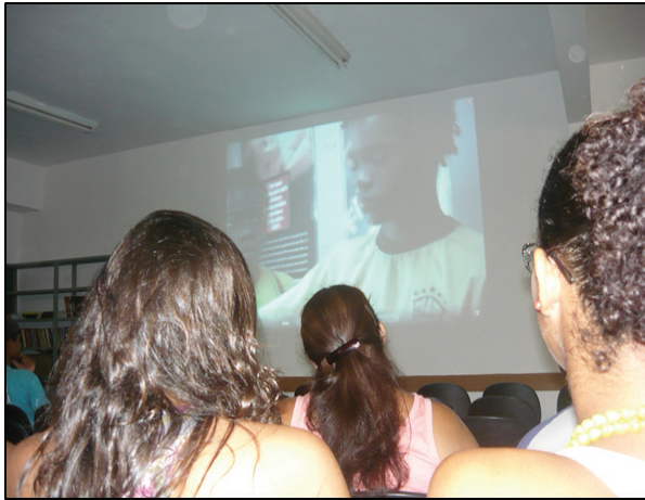
Foto N°3: Imagem do curta-metragem utilizado na oficina.