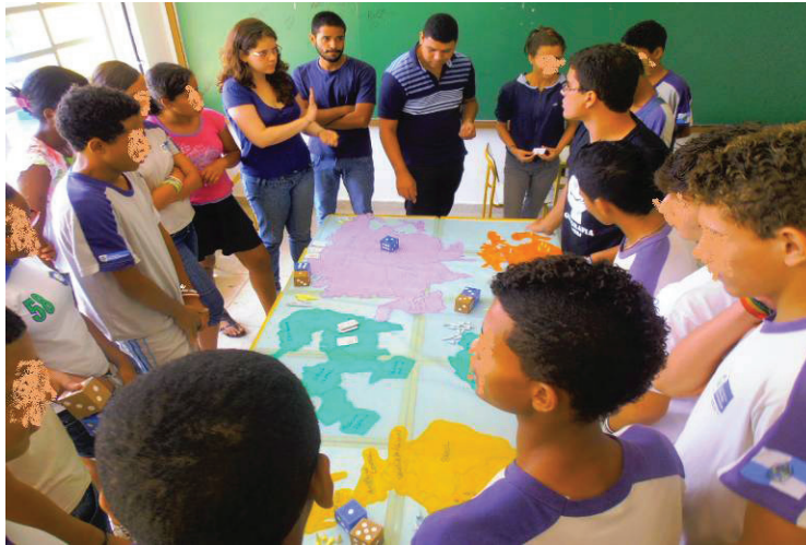
Foto Nº5: Produção do jogo do “War” ampliado e adaptado pelos alunos bolsistas e apresentação aos alunos de Seropédica.

consciência espacial. Significa, mutatis mutandis , pensar no conhecimento geográfico como possibilidade de apreensão crítica da realidade, dotada de valores, estratégias e cabedais políticos por vezes eclipsados pelo desconhecimento do espaço.