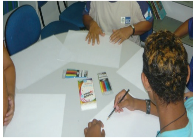
Foto N°4: estudantes iniciando produção dos mapas mentais dos bairros em que vivem.

dos Homens (ver foto 3), seguida de um debate onde se discutiu, baseado na obra de Yves Lacoste (1988), o papel dos mapas e sua relação com o poder. Ao final dessa atividade pediu-se aos alunos que desenhassem mapas mentais do bairro onde moram e do município de Seropédica (ver foto 4).