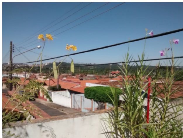
Figura 9: fotografia criada por Daniel