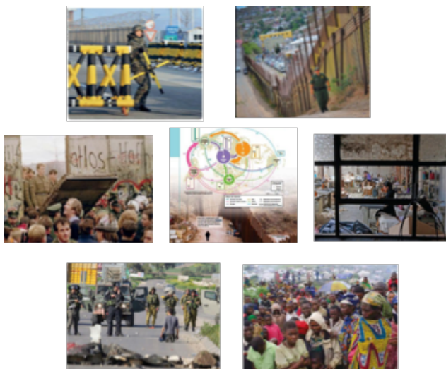
Figura 3. Série fotográfica “Fronteiras-problema”, composta por imagens das coleções didáticas

Interessante também é aquilo que, para Bruno, estas fotografias nos desautorizam a olhar, isto é, os sentidos de fronteira que elas acabam silenciando em função da persistência do referido discurso. Assim, em suas palavras: