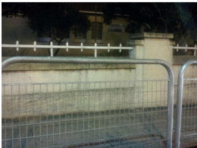
Figura 8: fotografia criada por Marina

de diversas formas se considerarmos os pensamentos e conhecimentos que os estudantes mobilizaram nas práticas de linguagem realizadas. Com os mapas, identificaram que as fronteiras podem criar limites e divisões, mas também despertar desejos e memórias, dependendo de quão aberta estão ao imprevisto e as nossas imaginações. Com as fotografias, entenderam que não só problemas e conflitos fazem parte das fronteiras, como também possibilidades e escolhas, se mudarmos o nosso ponto de vista e modo como olhamos ou perguntamos. As fronteiras, então, podem ser fixas e móveis, dentro e fora da escola, no momento em que compreendemos que as linguagens produzem o mundo e com elas decidimos transformá-lo no ensino de geografia.