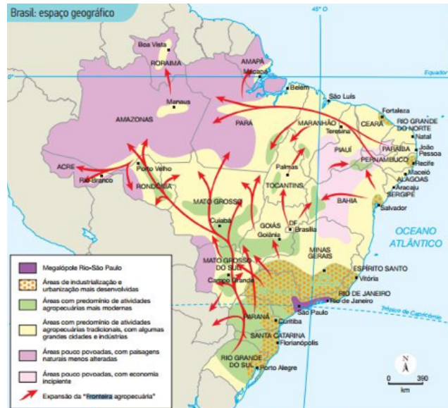
Figura 4: mapa da coleção didática Geografia Geral e do Brasil, vol. 3, 2013.

Os mapas abaixo participaram do processo de criação de Marina nesta atividade. A partir de seu trabalho, a representação da figura 4 se transformou na representação da